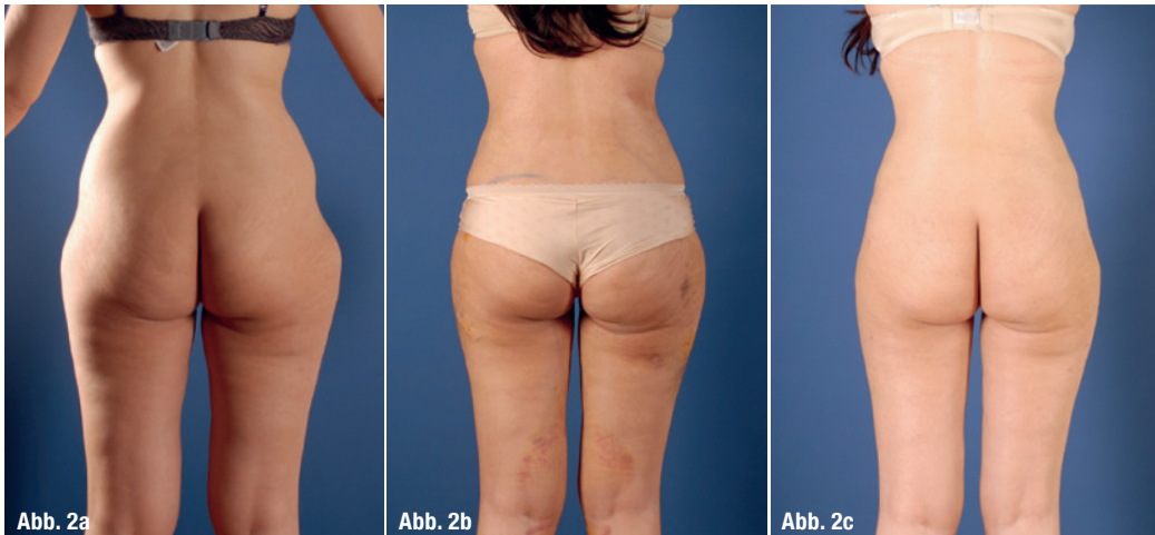
Abb. 2a–c: 31-jährige Patientin mit familiärer Veranlagung zu „Reiterhosen“ vor der Behandlung (a), fünf Tage nach der Entnahme von 3,2 Litern Fett (b) und zwei Monate postoperativ (c).

wird eine sanfte Fragmentierung ohne thermische Schädigung erreicht.