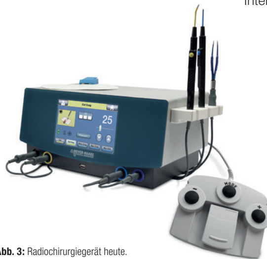
Abb. 3: Radiochirurgiegerät heute.

Radiofrequenzchirurgiegeräte bieten dem Chirurgen eine attraktive Operationsmethode. Sie stellen die minimalinvasive Form der Elektrochirurgie dar, da die Radiofrequenzgeneratoren mit deutlich höheren Frequenzen, Minimum 1 MHz, arbeiten. Dank der hohen Frequenz der Radiochirurgiegeräte kann mit wesentlich weniger Watt gearbeitet werden. Die Zellwände werden durch eine kapazitive Wirkung überbrückt, wobei die Energie direkt in die Zellen abgegeben wird. Durch histologische Untersuchungen konnte belegt werden, dass es zu wesentlich