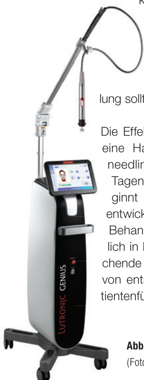
Abb. 4: GENIUS® RF-Microneedling System.

Die Effekte entwickeln sich in der Folgezeit, eine Hautverfeinerung durch das Microneedling zeigt sich relativ schnell nach Tagen, die Straffung braucht länger, beginnt nach sechs bis acht Wochen und entwickelt sich bis sechs Monate nach der Behandlung fort. Da die Effekte erst allmählich in Erscheinung treten, ist eine entsprechende Aufklärung und Fotodokumentation von entscheidender Bedeutung für die Patientenführung.