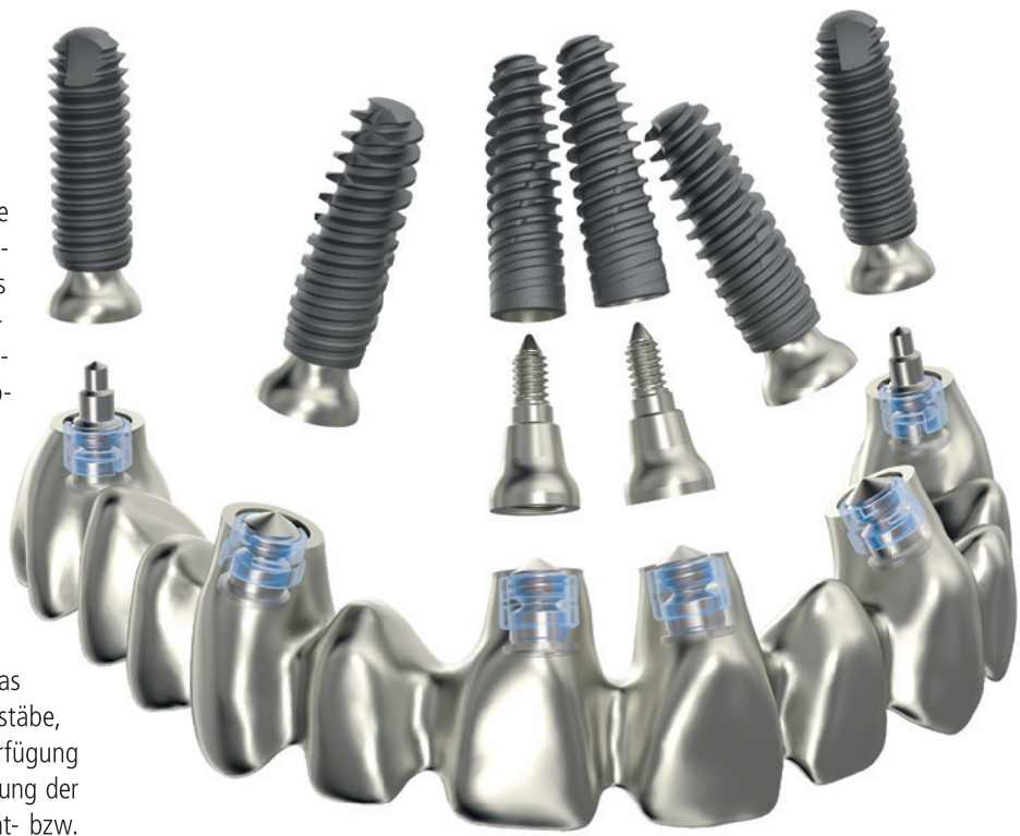
Abb. 3: Arcade Multi Level®.

besteht durch die prothetische Innenverbindung bei divergierenden Implantaten ein hohes Rückstellpotenzial der Abformpfosten innerhalb des Abformmaterials. Dieses Rückstellpotenzial birgt das Risiko von Interferenzen, die sich in einem hohen Maße auf die Passgenauigkeit der Suprastrukturen auswirken können, sodass sich eine zweite Abformung auf Abutmentniveau empfiehlt. Auch hier setzt das Multi Level®-Konzept neue Maßstäbe, indem Abformpfosten zur Verfügung stehen, die eine präzise Abformung der Implantatposition auf Abutment- bzw. Implantatschulterniveau ermöglichen. Dabei greift der Abformpfosten nicht tief in die Innengeometrie, sondern sitzt dem Implantat im Sinne einer Stoß-zu-Stoß-Verbindung flach auf. Dadurch sind auch Abformungen unter Verblockung der Abformpfosten möglich, sodass das Risiko von Übertragungsfehlern unwahrscheinlich ist. Im Gegensatz zu Stegkonstruktionen ist darüber hinaus bei okklusal verschraubten Brückenversorgungen die Lage des Schraubenkanals im Hinblick auf das ästhetische Ergebnis, aber auch zur Vermeidung von Chippings bzw. Abplatzungen von Kunststoffverblendungen wichtig. Auch hier zeigt sich ein wesentlicher Vorteil in der Neuentwicklung des Systems. Das System benötigt keine Multi-unit Abutments mehr, sondern kann mit der Suprakonstruktion direkt auf der Plattform des Tissue-Level-Implan-