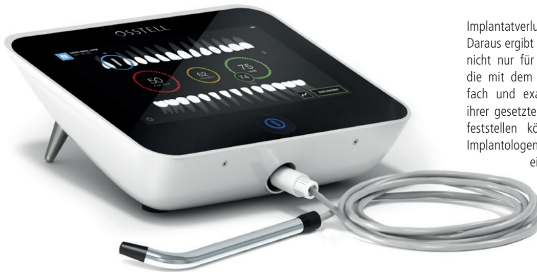
Abb. 2: Das W&H Osstell ISQ-Modul zur Prüfung der Primärstabilität des Implantats und der Osseo-integration ist auch in der Stand-alone-Variante Osstell IDx erhältlich.

das Wesentliche. Die Glasoberfläche des Gerätes lässt sich dabei einfach und sicher durch Wischdesinfektion reinigen.