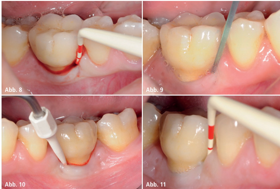
Fall 2 – Abb. 8: Klinische Situation der periimplantären Mukositis: Implantat mit Sondierungstiefe \leq 5 mm und BOP+. – Abb. 9: PERISOLV®-Applikation vor der Behandlung. – Abb. 10: Nichtchirurgische Behandlung – nach einer Einwirkzeit von 30 Sekunden wurde der Biofilm mit einem Ultraschallgerät mit PEEK-Spitze entfernt. – Abb. 11: Sechs Monate postoperativ: Sondierungstiefe \leq 4 mm und negativer BOP-Index.