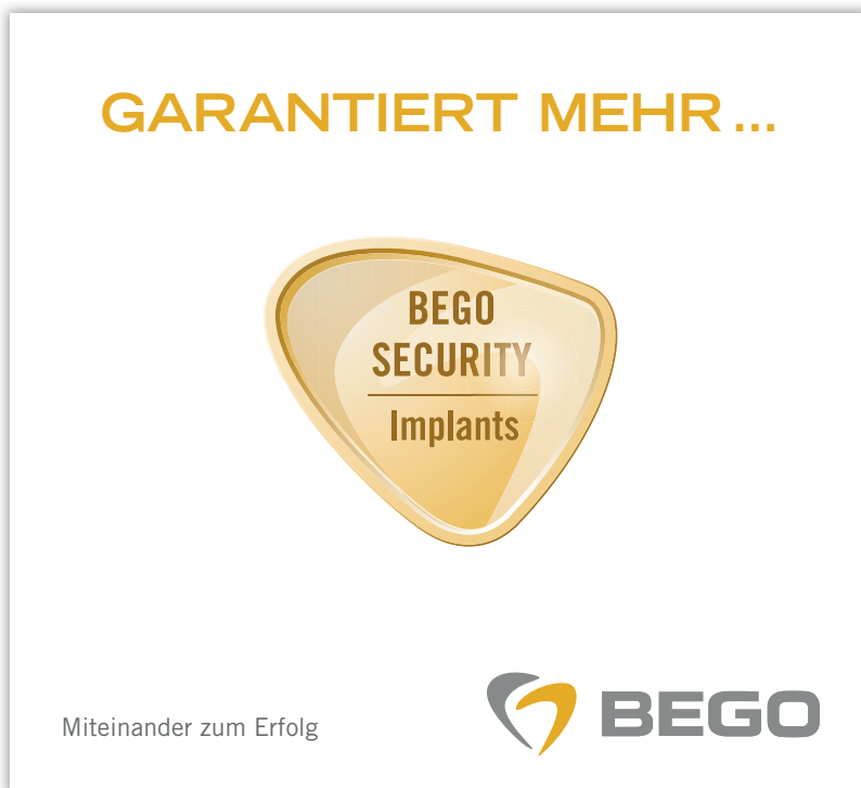
Abb. 3: ... als eine lebenslange Produktgarantie – durch Übernahme auch von externen Kosten.