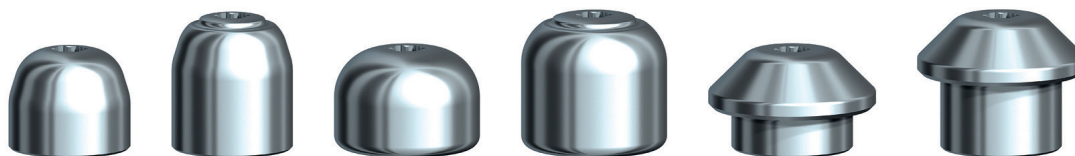
Abb. 2: Die Auswahl an Multi-unit Heilkappen wurde erweitert, um eine individuelle Behandlung verschiedener Anatomien zu ermöglichen.

Abutments macht eine Schraubenverankerung beim Try-in und eine Anpassung der provisorischen Versorgung überflüssig.