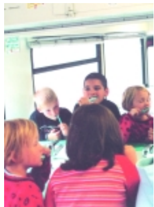
Gemeinsames Zähneputzen in der Zahnputzcke.

heitsämtern und Krankenkassen genutzt. Als Symbolfigur wählte die Initiative „Krocky“ ein lächelndes Krokodil, das wegen seiner starken Kiefer und Zähne für Kinder besonders einprägsam ist. KN