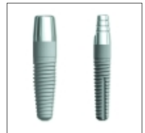
NobelDirect™ – Das 1-Stück-Implantat für eine einfache Handhabung.