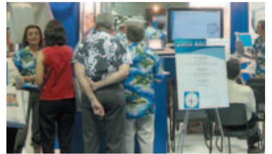
Parallel zu den Vorträgen informieren wieder führende Hersteller der Dentalindustrie in einer Ausstellung über neueste kieferorthopädische Produkte.

Bestseller-Autor und Amerikas beliebtester TV-Talker, Bill O'Reilly, sein. Einen weiteren Höhepunkt bilden mit Sicherheit die Darbietungen des Cirque du Soleil am Abend des 1. Mai (18 bis 21 Uhr, Downtown Disney). Wer jedoch bisher keine Karten vorbestellt hatte, schaut leider „in die Röhre“. Denn die Veranstaltung ist bereits restlos ausverkauft. Der diesjährige AAO-Gala-Abend wird auf dem Gelände der Universal Studios stattfinden (Montag, 3. Mai, Beginn 19 Uhr). Der Eintritt für den Themenpark, Essen, Trinken sowie Fahrten auf diversen Anlagen ist in der Anmeldegebühr aller registrierten Kongressteilnehmer enthalten.