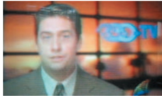
Auch zur diesjährigen Jahrestagung wird ein von der AAO produziertes tägliches Fernsehprogramm die Teilnehmer durch den Kongress navigieren.

Wer unter Ihnen ein regelmäßiger AAO-Kongressteilnehmer ist, weiß um die stets exklusiv gewählten Special Events, die das wissenschaftliche Programm in angenehmer Art und Weise umrahmen. So hat man sich auch dieses Jahr wieder einige Highlights einfallen lassen. Die traditionelle Eröffnungsfeier am Samstagabend (1. Mai) wird im Orange County Convention Center stattfinden. (Dieses ist übrigens auch der Veranstaltungsort sämtlicher wissenschaftlicher Vorträge sowie der Industrieausstellung.) Gastredner wird