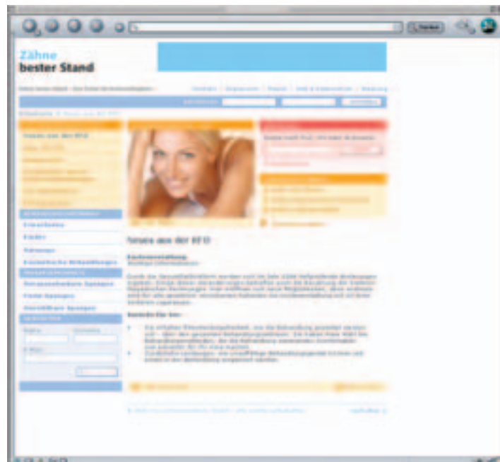
www.zaehne-besterstand.de, Rubrik: Neues aus der KFO.

Als einer der wichtigsten Bausteine der Kieferorthopädie-Medienkampagne ist das Patientenportal www.zaehne-besterstand.de anzusehen, dessen gut durchdachte Gliederung und anwenderfreundlicher Aufbau letztlich den Erfolg dieser wichtigen Schnittstelle zwischen Arzt und künftigen Patient ermöglichen.