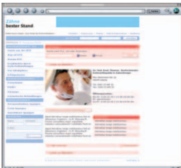
www.zaehne-besterstand.de, Rubrik: Arztsuche.