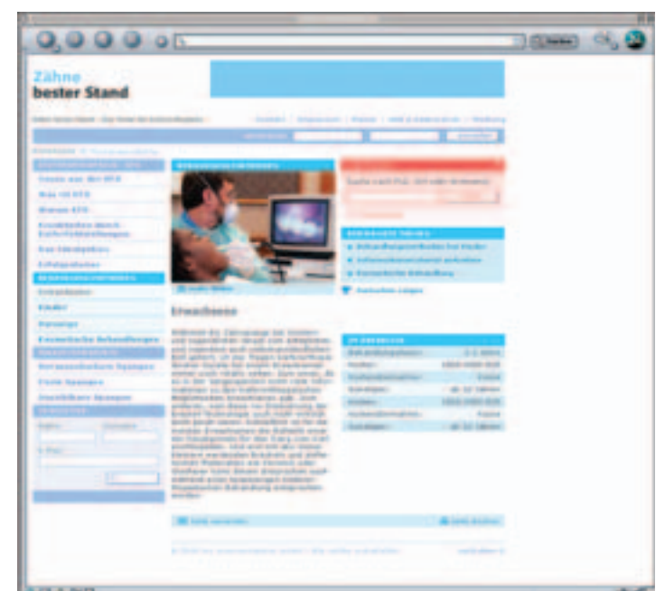
www.zaehne-besterstand.de, Rubrik: Erwachsene.