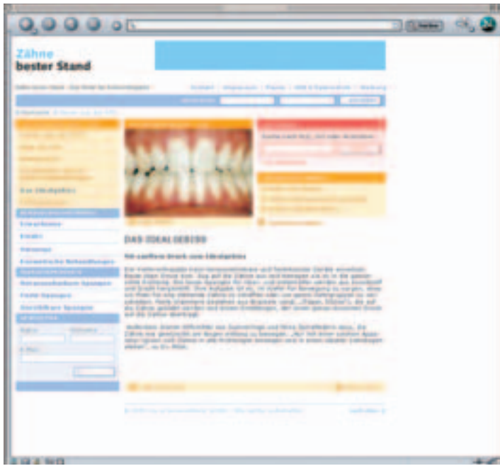
www.zaehne-besterstand.de, Rubrik: Das Idealgebiss.

halte aus dem Bereich Kieferorthopädie patientenfreundlich erklärt. Mittels Vorher-Nachher-Darstellung werden zudem die Wirkungsweisen verschiedener KFO-Behandlungstherapien anschaulich demonstriert. Die Themen bzw. Inhalte werden hierbei selbstverständlich re-