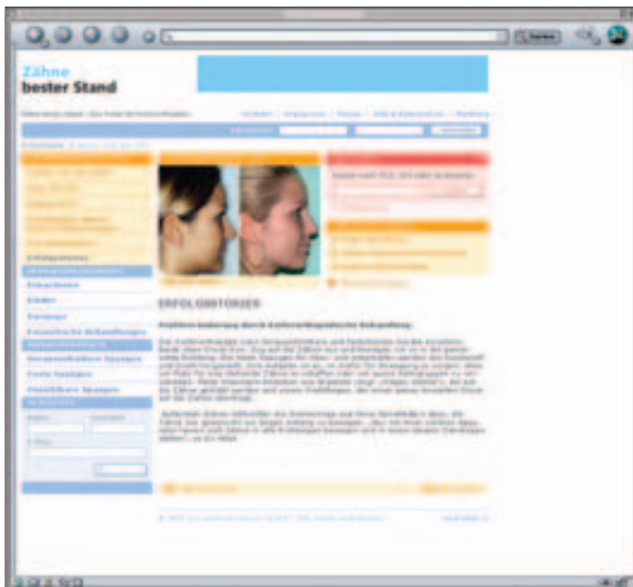
www.zaehne-besterstand.de, Rubrik: Erfolgsstories.