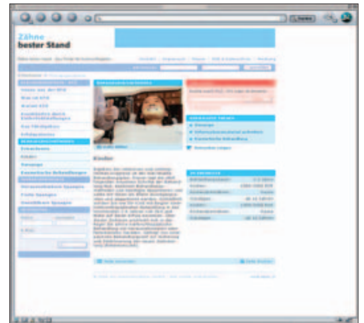
www.zaehne-besterstand.de, Rubrik: Kinder.

untergebracht. In diesen einzelnen Rubriken werden anhand von Fachberichten bzw. kurzen Artikeln Sachver-