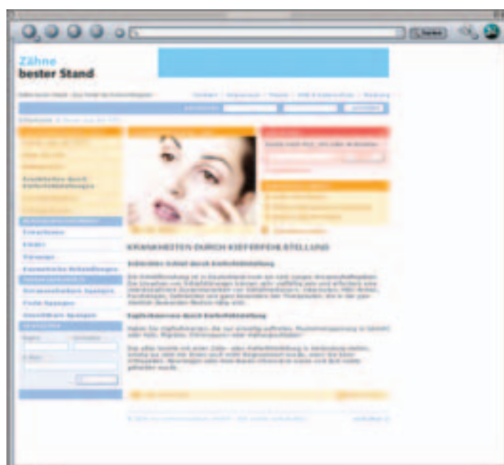
www.zaehne-besterstand.de, Rubrik: Krankheiten durch Kieferfehlstellungen.