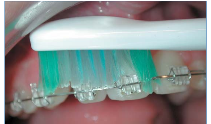
Die Reinigung von Brackets ist schwerer und das Karies-Risiko höher. Hier wird Prophylaxe umso wichtiger.

Seminare zur Integration der Prävention in die KFO-Praxis bietet aktuell DENT-x-press (Anmeldung per Fax unter