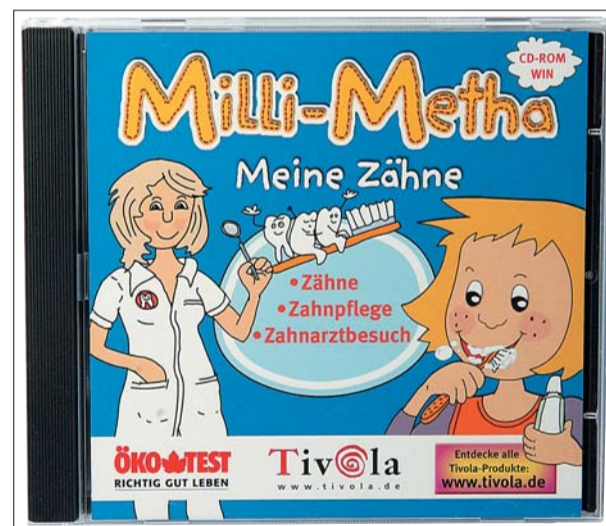
Die Lernsoftware „Milli-Metha: Meine Zähne“ für Kinder ab fünf Jahre.

Mit der umfangreichen Mischung aus kurzweiligem Spaß, eingängiger Information und zahlreichen Tipps rund um die richtige Zahnpflege kann sich insbesondere die zahnärztliche Praxis ein originelles und lehrreiches Service-Angebot zur Förderung ihrer kleinen Patienten sichern. Systemvoraussetzungen für den Einsatz von „Milli-Metha: Meine Zähne“ ist dabei ein PC: Pentium 300 MHz (Mindestanforderung), 64 MB RAM, CD-ROM-Laufwerk (8-fache Geschwindigkeit), DirectX-kompatible Grafik- und Soundkarte, Win 98/ME/2000/XP. Mit dem Vertrieb dieser PC-Lernsoftware erweitert der VFZ jetzt seine vielseitige Angebotspalette an Lernmaterialien erstmals um ein multimediales Produkt. ☒