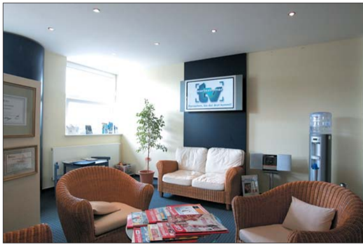
Filme aus über 300 Themen bilden das Rahmenprogramm für die Kommunikationsinteressen des Arztes.

Letztlich versteht sich TV-Wartezimmer aber hauptsächlich als Dienstleister für den Arzt selbst – seine Kommunikationsinteressen stehen im Vordergrund und somit ist das Rahmenprogramm mit Tier- und Naturfilmen, tagesaktuellen Nachrichten und Wettermeldungen nur „schöne Verpackung“ für die Vorstellung der Praxis, des Teams, allgemeine Informationen und vor allem die Filmbeiträge zu den praxisindividuellen Selbstzahlerleistungen von „A“ wie Akupunktur bis „Z“ wie Zilgrei. ☒