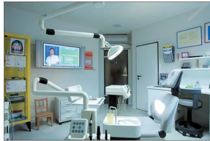
Auch eine ergänzende Installation im Behandlungszimmer ist möglich.