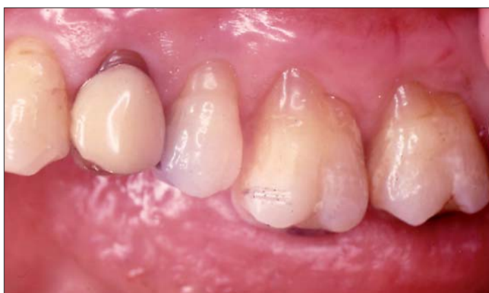
Abb. 1a: Obere linke molare und prämolare Übereruption durch Verlust von Zähnen im gegenüberliegenden Zahnbogen.