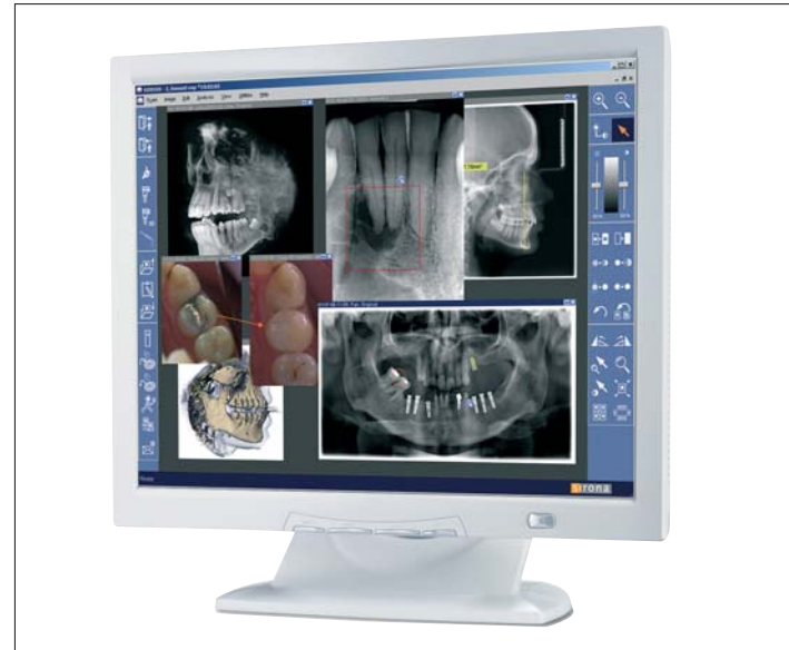
SIDEXIS XG V2.4 – die moderne Bildverarbeitung von Sirona ermöglicht die Verarbeitung verschiedenster Bildinformationen in Ihrer Praxis.

deutlich verbessert und bedienerfreundlich gestaltet. Auch der Aufwand für die Installation der Aktualisierungen und Patches ist mit XGNetDeploy dank einer Manager-Anwendung deutlich einfacher und schneller geworden. Für Anwender älterer SIDEXIS-Versionen (kleiner V2.0) und Umsteiger auf Windows Vista™ gibt es nun neben dem bekannten Update auch ein separat bestellbares Upgrade. KN