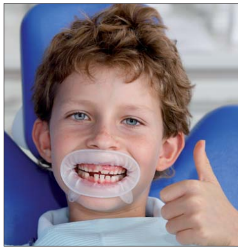
OptraGate Junior ExtraSoft bietet hohen Tragekomfort.

OptraGate Junior ExtraSoft – sanfte Erweiterung kleiner Patientenmünder.