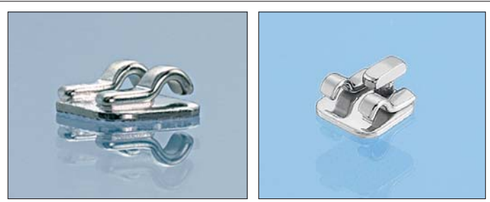
Mit einer Gesamthöhe von lediglich 1,3 mm sind die neuen 2D® Lingual-Brackets von FORESTADENT die derzeit flachsten der Welt. Das neu entwickelte 2D® Lingual-Bracket mit T-Haken dient zum Einhängen von Elastikketten.

Die 2D® Lingual-Brackets aus dem Hause FORESTADENT gibt es jetzt in neuen Varianten. Diese überzeugen nicht nur durch eine exzellente Biomechanik und vielseitige Einsetzbarkeit, sondern vor allem auch durch ihr einfaches Handling. In Kombination mit den speziell für die Lingualtechnik entwickelten BioLingual®-Bögen bieten sie somit optimale Voraussetzungen für eine erfolgreiche Behandlung.