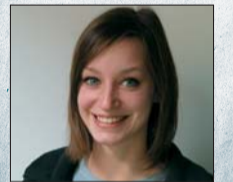
Josephine Ritter (Layout und Satz)