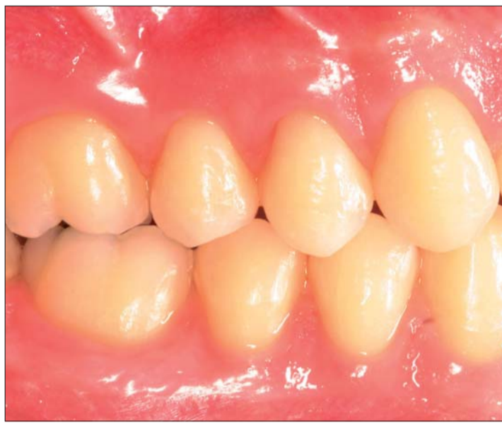
Abb. 18a-c: Situation zu Behandlungsende.