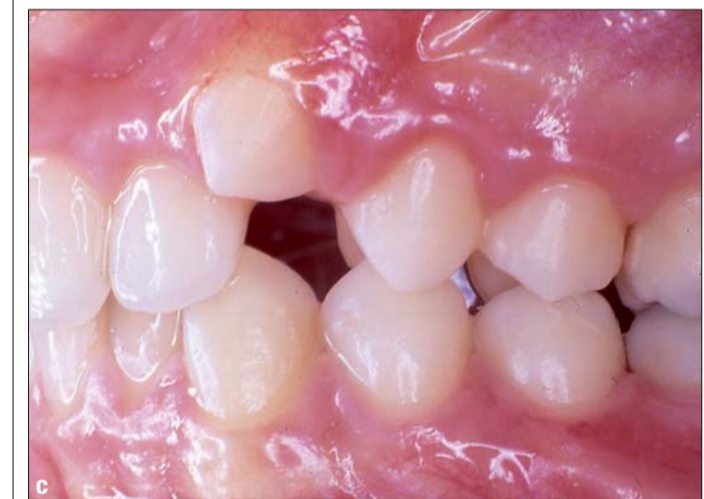
Abb. 13a-c: Klasse II-Malokklusion vor der Behandlung.

KN Fortsetzung des Artikels „Compliance-unabhängige KFO-Verankerungen“ aus KN 1/2-2009.