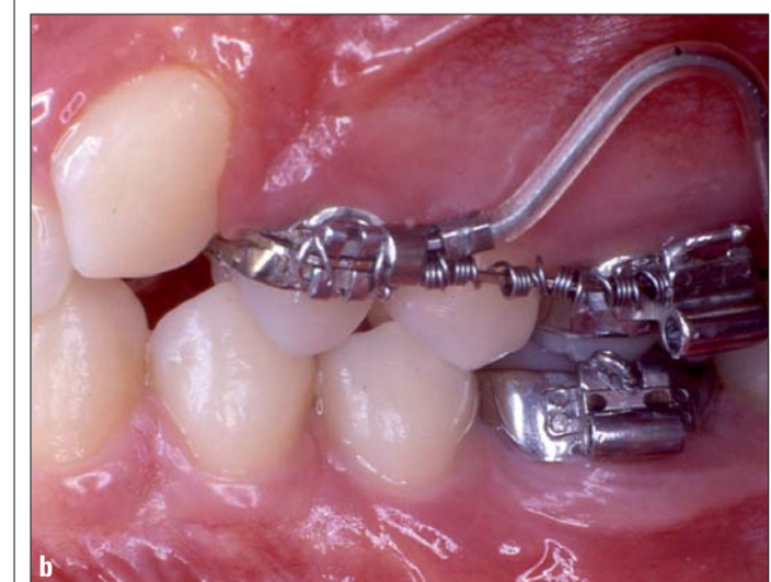
Abb. 14a, b: SUMODIS (Simultaneous Upper Molar Distalizing System) in Position.