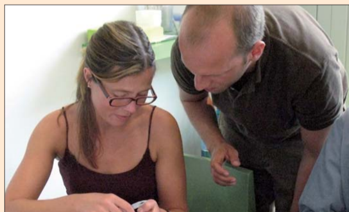
Bei intensiver Betreuung durch das Referenten-Trio können die Teilnehmer gleich selbst Hand anlegen und Schritt für Schritt eine Distalisationsapparatur fertigen.