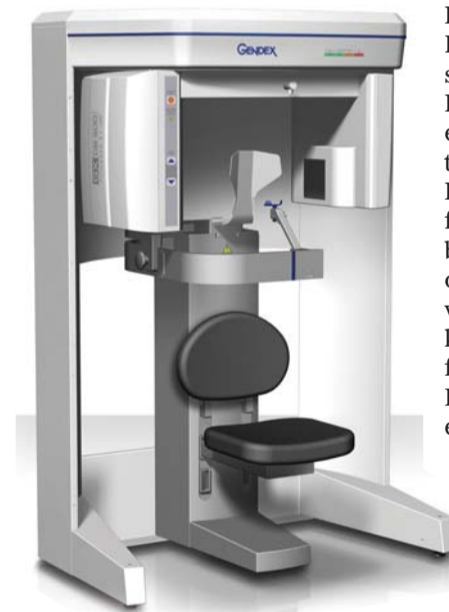
3-D-Cone-Beam-VT GXCB-500 (KaVo/Gendex).

Nachdem in Köln die Zahl der Aussteller im Bereich KFO wie erwartet klein war, darf man gespannt sein, was die nächste, dann rein kieferorthopädische Fachmesse an Neuheiten bringt. Diese wird in wenigen Wochen im Rahmen des AAO-Kongres-