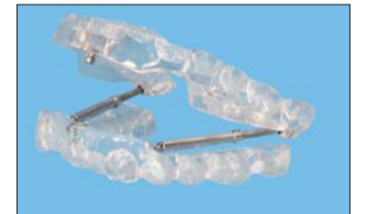
Roncho Ex-Schnarchschiene (bredent).

Bei den Alignern gibt es bezüglich der bekannten In-Line®-Schienen des Rasteder