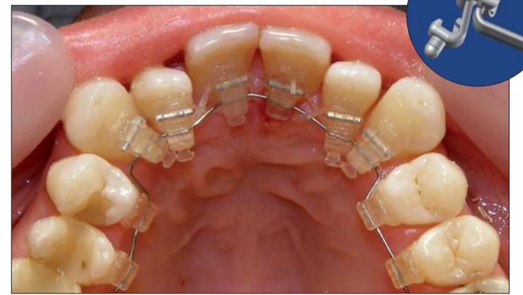
phantom™ (Gestenco) mit placement-jig (Kreis).

Das heißt der Patient befindet sich in Liegeposition, sodass die Korrektur der Patientenposition mittels Vorschaubilder über den Monitor erfolgen kann. Was die technischen Daten angeht, beträgt das