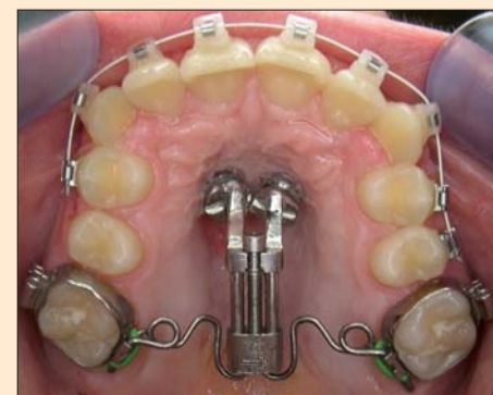
Neben dem K-Pendulum wird im Kurs auch die Frosch-Apparatur (Foto) als Non-Compliance-Variante zur Molarendistalisation detailliert vorgestellt werden.

ihren Aspekten, Möglichkeiten, Vorteilen, vermeidbaren Fehlerquellen sowie Grenzen vor. Das Seminar ist in drei Teile untergliedert, die den Teilnehmern neben sämtlichen theoretischen Grundlagen sowie der labortechnischen Umsetzung vor allem die praktische Anwendung vermitteln werden.