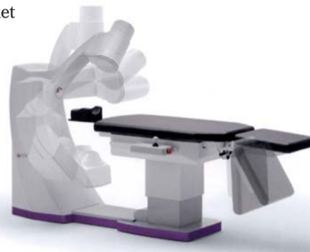
Cone-Beam-CT sky View (myray)

Im Bereich der digitalen Diagnostik machte die italienische Firma myray mit einer Messeneuheit auf sich aufmerksam. Und zwar stellte sie u.a. ein neues Cone-Beam-CT namens skyVIEW vor, welches inklusive Software seit Kurzem verfügbar ist. Hinsichtlich des Designs fällt bei diesem Gerät sofort der offene C-Bogen auf.