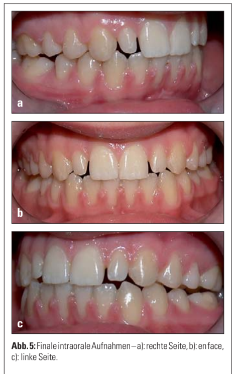
Abb. 5: Finale intraorale Aufnahmen – a): rechte Seite, b): en face, c): linke Seite.

Im vorliegenden Fall basierte die Entscheidung für eine Therapie ohne Extraktionen auf den neutralen Cephalogrammwerten, dem harmonischen Profil, jugendlichen Alter und der guten Motivation der Patientin. Die orthopädische Behandlung mit einem bimaxillären Carrière®-Distalizer gestattete – neben der Re-Etablierung einer Klasse I-Stellung – die distale Inklinierung und Rotation der oberen Molaren, wie José Carrière sie in seiner Beschreibung der Apparatur definiert hat. 21 Die Anwendung der MEA-Technik (Multiloop Edgewise Archwire) gestattete die Verringerung des offenen Bisses, der weniger aus der Intrusion, sondern vielmehr aus der Extrusion der Schneidezähne und der Aufrichtung der Molaren resultierte. 22 Die Verlängerung der Behandlung durch das temporäre Rezidiv der Zungendysfunktion zeigte, dass eine Eliminierung aller destruktiven oralen Gewohnheiten eine fundamentale Voraussetzung für ein langfristig stabiles therapeutisches Ergebnis ist.