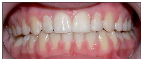
Abb. 6: Restaurierte Zähne 21 und 22.