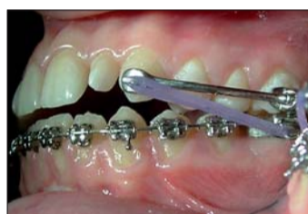
Abb. 3: Carrière®-Distalizer intraoral.

oberen Zähne, kombiniert mit einer Vorwärtsbewegung der Mandibula, Intrusion der ersten Molaren in beiden Zahnbögen, c) Extrusion der maxillären Schneidezähne und ästhetische Restauration der Zähne 21 und 22 sowie d) Retention. Als erster Therapieschritt erfolgte die Frenulektomie der Unterlippe mit Kürettage des Ansatzes zwischen den Wurzeln der Schneidezähne. Danach wurde die Pa-