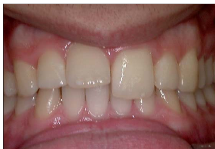
Abb. 1: Elongierter 21 nach Bruch des Retainers.

Rezidive im Frontzahnbereich nach abgeschlossener Multibandbehandlung sind keine Seltenheit. Meistens manifestieren sie sich in der Unterkieferfront. Gelegentlich sind auch die Oberkieferfrontzähne betroffen, so wie im vorliegenden Fall. Hier erfolgte die Korrektur mittels 2D-Lingualapparat. Von Dr. Jakob Karp.