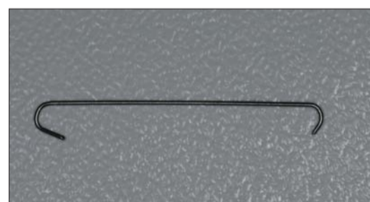
Abb. 7: Teilbogen aus Nickeltitanium.