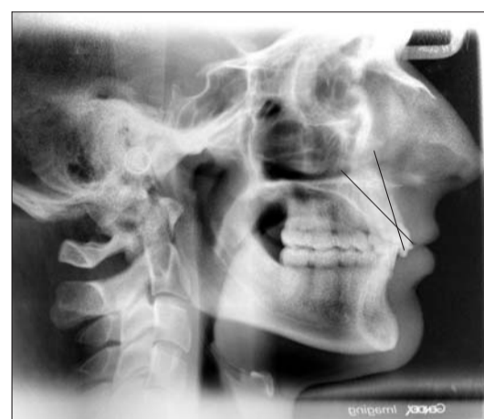
Abb. 3: Unterschiedliche Achsenneigung der Inzisivi.