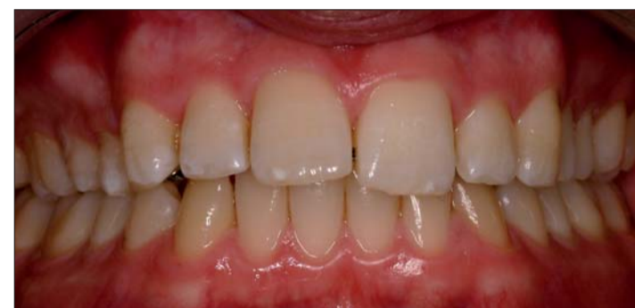
Abb. 9: Torque beginnt zu wirken.

Die zweidimensionale Behandlungsmethode ist eigentlich für leichtere kieferorthopädische Fälle gedacht. Benutzt man jedoch eine entsprechende biomechanische Vorrichtung, die ein Drehmoment erzeugen kann, gelingt es auch, Torque bis zu einem gewissen Umfang zu erhalten. An