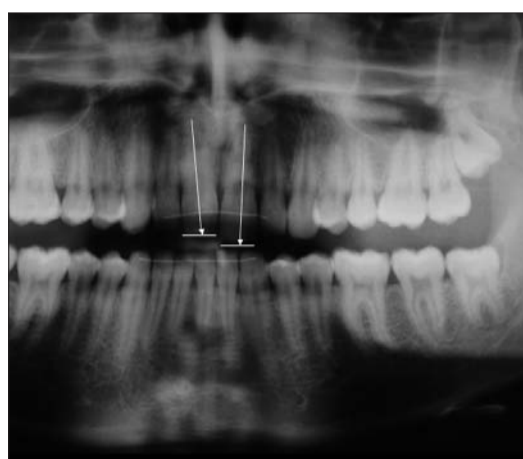
Abb. 4: Deutliche Elongation des Zahnes 21.