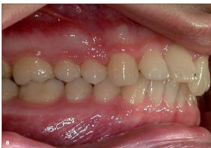
Abb. 2a, b: 21 Steilstand und elongiert.