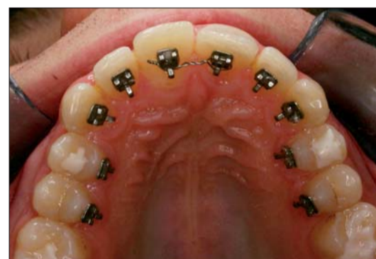
Abb. 5: 2D-Lingualapparat eingesetzt.