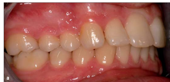
Abb. 10a, b: Kontrolle nach zwei Jahren.