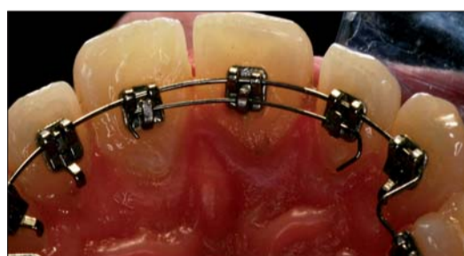
Abb. 8: Teilbogen eingegliedert.

sentierte sich deutlich verlängert und hatte im Verbund mit seinen Nachbarzähnen eine ungünstige Achsenneigung (Steilstand). Das Fernröntgenseitenbild