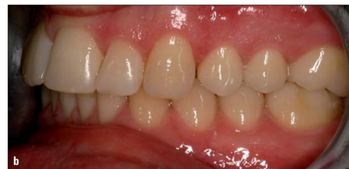
Abb. 11: Zwei Jahre nach Abschluss der aktiven Behandlung.