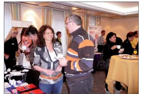
Viele nutzten die Pausen, um sich an den Ständen der Industrie über neueste Produkte zu informieren.