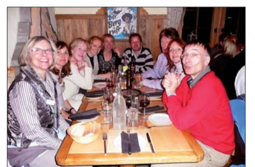
Auch in gemütlicher Runde wurde weiter gefachsimpelt.