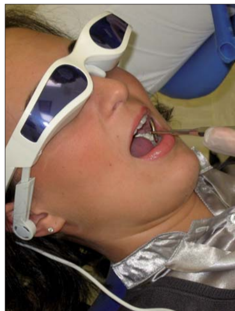
Die Videobrille cinemizer Plus von Carl Zeiss sorgt für Entspannung während der Behandlung.

Laut einer repräsentativen Umfrage der Initiative proDente hat jeder fünfte Deutsche Angst vor einem (Fach-)Zahnarzt.