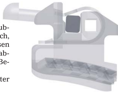
Der neue BioFinisher®-Bogen von FORESTADENT – für den perfekten Abschluss der Multibandtherapie.

Das Pforzheimer Traditionsunternehmen FORESTADENT hat die Palette seiner intelligenten