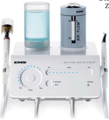
Air-Flow Master Piezon: Ergonomie und Leistungskontrolle auf minimalem Raum. Die Überwachungsleuchten und das einfach zu reinigende Touch Panel haben eine funktionale und moderne Optik.

Was sich zunächst als ein wenig paradox anhört, wird bei näherer Betrachtung zur logischen Schlussfolgerung. Um dem Zahnarzt sub- und supragingivales Air-Polishing und Scaling in einer Prophy-