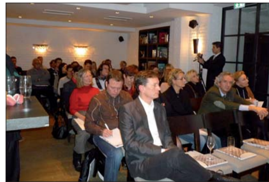
Über 30 Kieferorthopäden waren der Einladung ins Bogenhausener Restaurant Käfer gefolgt.

spricht. Bracketplatzierungen können somit absolut sicher und kippelfrei erfolgen. Zudem ging der Referent auf das überarbeitete Design der interaktiven Verschlussklammer mit Fangfunktion sowie den ebenfalls neuen, umlaufenden Padrand ein. Inwieweit aufgrund ihres Zusatzslots (0.0160 x 0.0160) die Behandlungsmöglichkeiten