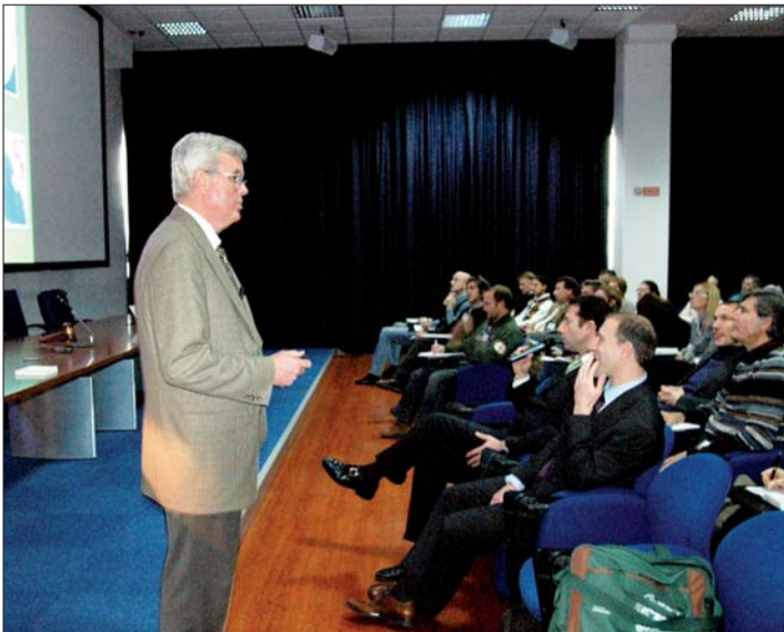
Rund 300 Teilnehmer hatten die Gelegenheit dieses Zwei-Tages-Kurses wahrzunehmen, um Kieferorthopädie auf höchstem Niveau zu erleben.