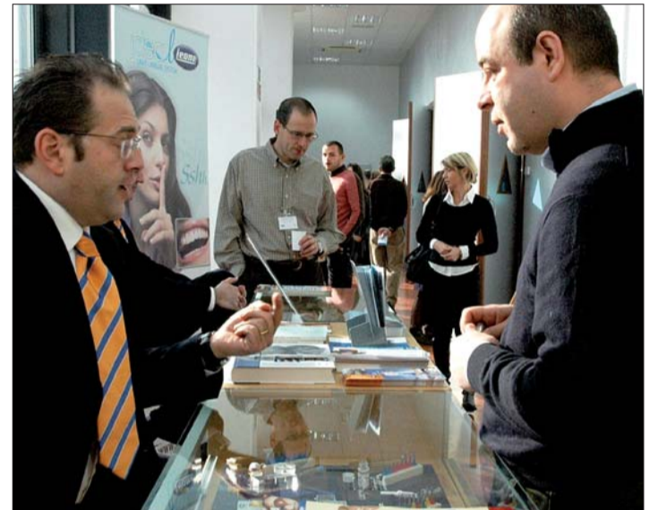
Veranstalter Leone präsentierte sich den internationalen Teilnehmern mit guter Organisation und innovativen Produkten.