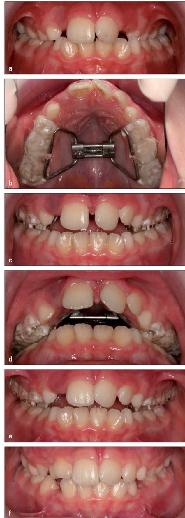
Abb. 4a-f: Frühbehandlung mit acht Jahren. (a): Anfangsbefund: unilateraler Kreuzbiss; (b): Acrylschiene-Apparatur; (c): nach 16 Aktivierungs-; (d): transversale Überkompensation; (e): Diastema-Rückbildung sechs Wochen nach Aktivierungsende; (f): Befund nach einem Jahr.

In Kombination mit der Protraktion der Maxilla wird die GNE zur Therapie der Klasse III eingesetzt, die generell in prognathen Gesichtstypen erschwert zu behandeln ist. Bei Zugrundelegung einer kephalometrischen Analyse mit fließenden Normen und leitenden Variablen (Hasund) wird dies deutlich. Hier zeigt sich u. a. eine vergleichbare Interpretierbarkeit des ANB-Winkels und der Wit's appraisal. Außerdem sollte bei Klasse III-Fällen neben der strukturellen Wachstumsanalyse nach Björk, Solow und Ödegaard auch die Familienanamnese zur Prognose herangezogen werden. In moderaten Fällen kann mittels GNE/Protraktion eine spätere gnathisch-chirurgische Therapie vermieden werden. In sorgfältiger Analyse aller kieferorthopädischen Anfangsunterlagen soll der Charakter der Dysgnathie bzw. Malokklusion abgeklärt werden. Funktionelle Parameter wie Zungenlage und -funktion, Tonsillenausprägung und Art der Atmung sind zu beachten. In Fällen mit Platzmangel darf die Extraktion bzw. Non-Extraktions-Entscheidung nicht allein aufgrund des zu erwartenden Platzgewinns durch