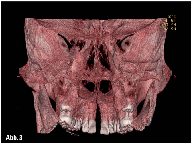
Abb. 1-3: CT-Darstellung der skeletalen Wirkung bei Spätbehandlung mit 17 Jahren; Zustand am Ende der Aktivierung bei kurzzeitiger Apparaturentfernung. (1): geöffnete Gaumennaht in axialer Primärschicht auf Höhe der Apices; (2): enge Lage der Wurzeln zur bukkalen Kortikalis; (3): Dorsalsicht in 3-D-Reformatierung.