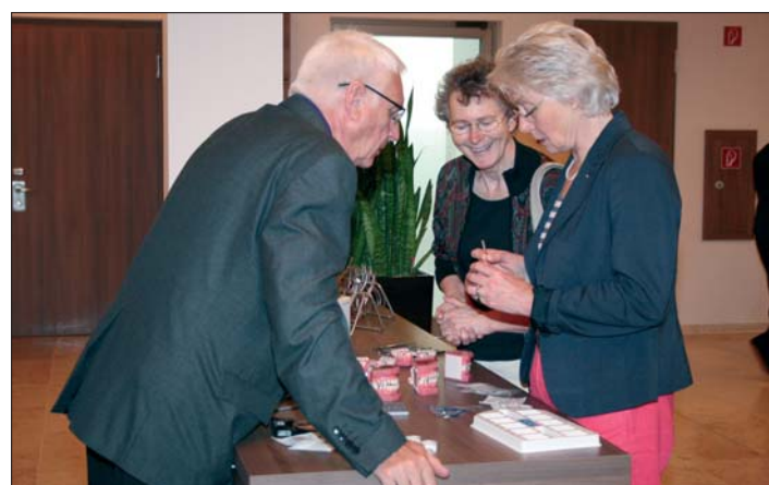
Wer wollte, konnte sich in den Pausen über die komplette ODS-Produktpalette informieren.