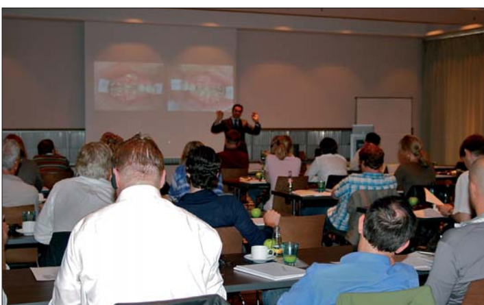
Rund 50 Kieferorthopäden folgten im Düsseldorfer Hotel Meliá interessiert den Ausführungen des Referenten.

ODS GmbH Dorfstraße 5f 24629 Kisdorf Tel.: 0 41 93/96 58 40 Fax: 0 41 93/96 58 41 E-Mail: info@orthodont.de www.orthodont.de