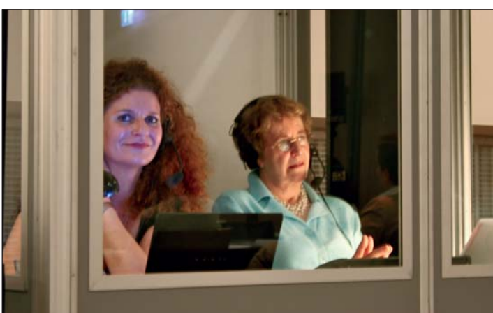
Fachlich absolut top war die Simultan-Übersetzung des in englischer Sprache gehaltenen Kurses.