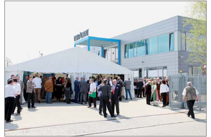
Die neue ULTRADENT-Firmenzentrale in Brunenthal.

Einweihung der neuen ULTRADENT-Firmenzentrale in Brunenthal.