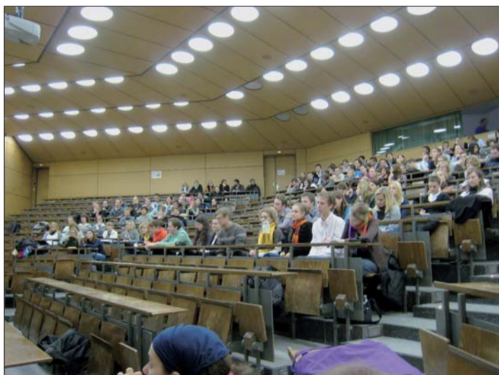
Die Projekte des BdZA richten sich an junge Zahnmediziner in Deutschland.

BdZA arbeitet an neuen Schwerpunktthemen und Projekten für junge Zahnmediziner.