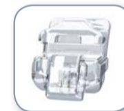
Der innovative SpinTek™-Schiebemechanismus für einfache Bogenwechsel

Klare Leistung, Optimale Stabilität, Komfortable Passform, Präzise Bracketplatzierung.