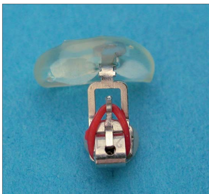
Abb. 1: Einzelnes Übertragungstray fertig zum Einsatz in den Mund des Patienten.