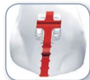
Eine herausnehmbare Positionierhilfe für akkurate Platzierung der Brackets.

Damon Clear™ vereint die klinisch erprobten Eigenschaften eines nahezu reibungsfreien, passiv selbstligierenden Systems mit den ästhetischen Ansprüchen, die imagebewusste Patienten heute stellen. Das Ergebnis sind kristallklare Brackets, die alle Erwartungen an Schönheit und Funktionalität übertreffen.