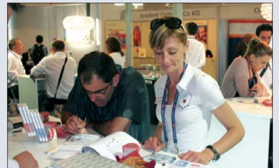
Ohne Zweifel ist der Gang über die parallel stattfindende Industrieausstellung stets lohnenswert.