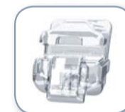
Der innovative SpinTek™-Schiebemechanismus für einfache Bogenwechsel

Klare Leistung, Optimale Stabilität, Komfortable Passform, Präzise Bracketplatzierung.