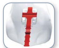
Eine herausnehmbare Positionierhilfe für akkurate Platzierung der Brackets.

Damon Clear™ vereint die klinisch erprobten Eigenschaften eines nahezu reibungsfreien, passiv selbstligierenden Systems mit den ästhetischen Ansprüchen, die imagebewusste Patienten heute stellen. Das Ergebnis sind kristallklare Brackets, die alle Erwartungen an Schönheit und Funktionalität übertreffen.