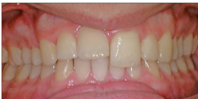
Abb. 1: Elongierter 21 nach Bruch des Retainers.

len Behandlungstechnik ein grundlegendes Problem dar, da man sich vom Kraftansatz her auf der falschen Seite befindet. Die Behandlung jedoch mithilfe einer dreidimensionalen Lingualapparatur durchzuführen, erschien zu aufwendig und teuer und hinsichtlich des Torqueausgleichs nicht unbedingt zum Ziel führend. Daher wurde in diesem Fall eine modifizierte zweidimensionale Apparatur gewählt, bei der die Möglichkeit des Einsatzes von zwei Bögen besteht. Mithilfe einer speziellen Konstruktion gelang es, über einen Hebelarm die isolierte Korrektur der Zahnachse ohne nennenswerte