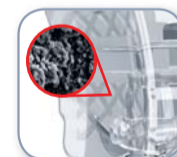
Eine patentierte, gelaserte Basis für optimale Verbundfestigkeit und Zuverlässigkeit.