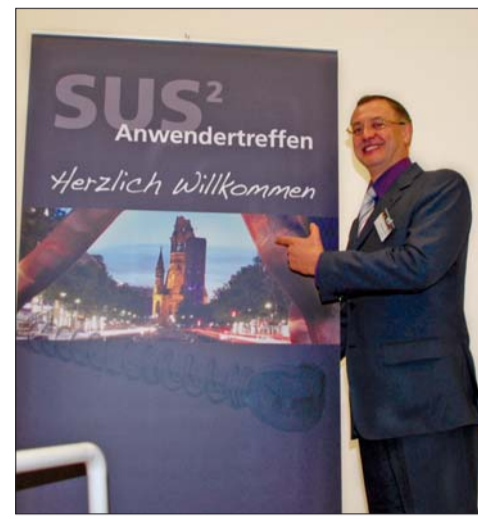
Gab wie weitere bekannte Referenten seine Erfahrungen rund um den klinischen Einsatz der Sabbagh Universal Spring weiter – Dr. Aladin Sabbagh.

Mit dem ersten SUS 2 -Anwendertreffen hatte die Dentaurum-Gruppe Mitte Oktober zu einem Top-Event in die Hauptstadt geladen. Rund 100 Teilnehmer folgten dieser Einladung mit großem Interesse. Eingeläutet wurde das Treffen mit einem exklusiven Abendessen im Feinkostrestaurant Käfer auf der Dachterrasse des Reichstages. Das Käfer-Team zauberte leckere Gaumenfreuden in eleganter Atmosphäre. Mitten im Stadtzentrum hatten die Gäste während des Dinners die Gelegenheit,