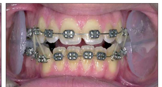
Der „Alifix“ aus Silikon funktioniert als lose im Mund liegendes Trainingsgerät (a) für die Kaumuskel und kann allein (b) oder in Kombination mit festen Apparaturen (c) eingesetzt werden.