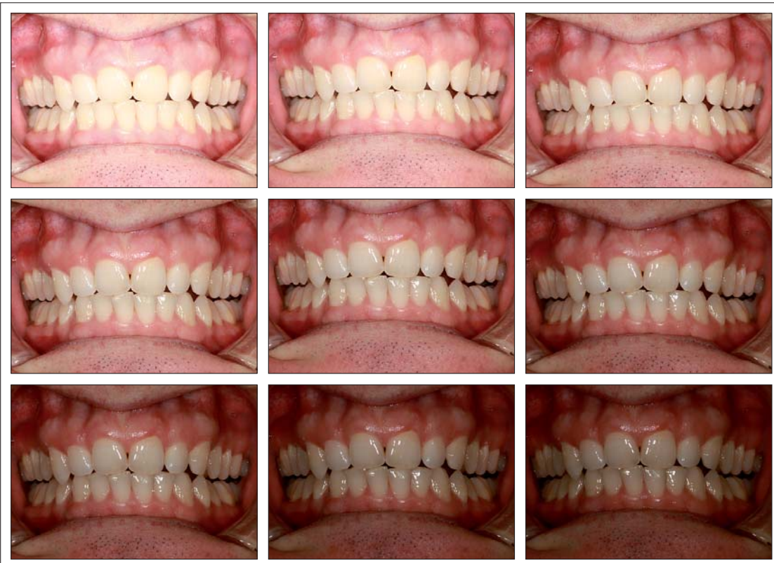
Abb. 3: Arbeitsschritt 2: Ermittlung der perfekt passenden Blendenstufe zur in Aufnahmeserie 1 gefundenen Blitzleistungsstufe. Ist diese bestimmt, stehen auch bereits die Parameter für den ersten Standard fest (hier: z. B. für den Abbildungsmaßstab 1:3 = ganzer Zahnbogen).

der Fotografie an den Mann oder die Frau zu bringen.