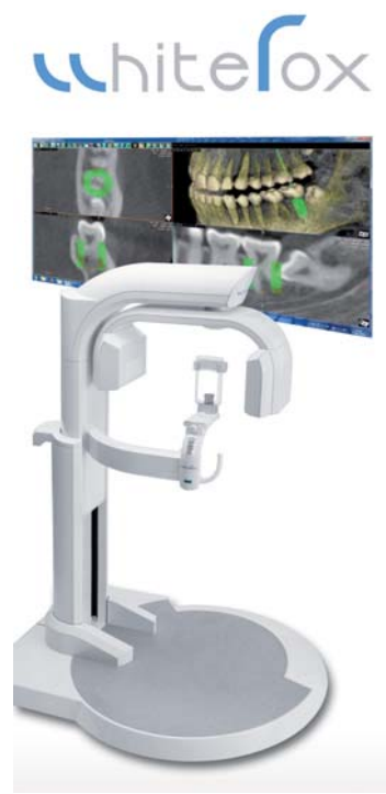
WhiteFox (Fa. Satellec/Acteon Group).

Erstmals auch als Hersteller von Drähten präsentierte sich Dentalline. Deren Bogenpalette „Dentalline Wires“ umfasst das komplette Spektrum kieferorthopädischer Drähte neuester Materialien und wird in Kürze noch um zusätzliche Bogenvarianten ergänzt. Die Firma mit Sitz in Pforzheim ist zudem ab sofort Exklusivhändler des BENEFIT-Schraubensystems für ganz Europa. Die Firma Hammacher stellte eine neue Stoppsetzange vor. Diese aus rostfreiem Stahl gefertigte, 130 mm lange Zange ermöglicht insbesondere im Seitenzahnbereich das präzise Anbringen von Stopps. Seit Ende letzten Jahres auf dem Markt und insbesondere auch