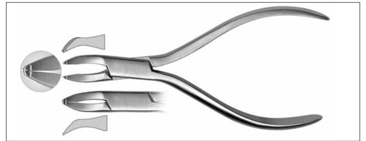
Stoppsetzange (Fa. Hammacher).

zeichnen. Hierzu laufen momentan internationale Studien, deren Ergebnisse im Sommer vorliegen sollen.