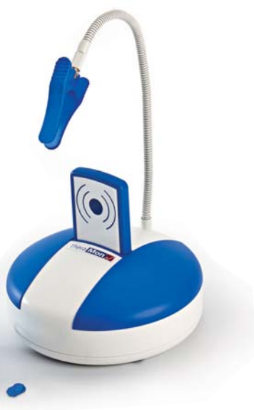
TheraMon® (Handelsagentur Gschladt).

Eine innovative Neuheit zeigte die italienische Firma SIA Orthodontic Manufacturer mit KLIK. Hierbei handelt es sich um eine Ligatur, die auf das Bracket aufgeklickt wird. Laut Herstellerangaben sollen Patient und Behandler somit die „Vorteile eines Low-Friction-Brackets zum kleinen Preis“ erhalten. Die Bögen könnten frei im Slot gleiten, was zu kürzeren Behandlungszeiten führe. Die KLIK-Ligaturen können laut SIA aus-