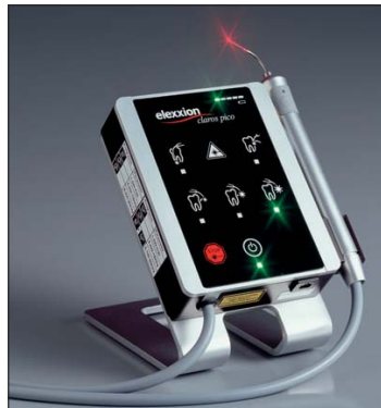
claro pico (Fa. elexxion).

schließlich mit Brackets gleicher Firma verwendet werden, Systeme anderer Hersteller würden wohl nicht funktionieren.