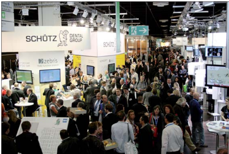
Rund 115.000 Besucher aus aller Welt informierten sich fünf Tage lang über die Neuheiten der internationalen Dentalindustrie.