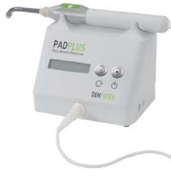
PAD™ PLUS (Fa. Dentoflex/orangedental).

Das TheraMon®-System zur Dokumentation der Tragedauer herausnehmbarer KFO-Apparaturen ist seit Ende 2010 nun kommerziell verfügbar und erfreute sich in Köln reger Nachfrage. So ist neben dessen Einsatz bei