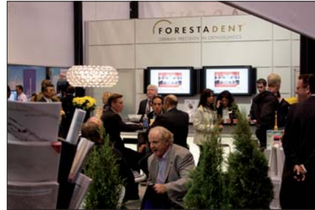
An insgesamt vier AAO-Messetagen nutzten zahlreiche Kongressteilnehmer die Möglichkeit, sich über Produkte aus dem Hause FORESTADENT zu informieren und Bestellungen für die Praxis zu tätigen.

Ausschließlich für den amerikanischen Markt übernimmt FORESTADENT USA ab sofort den Vertrieb des dentalen Diodenlasers Einstein DL der Firma DC International LLC. Hierbei handelt es sich um einen Laser, welcher speziell für die Behandlung von Weichgewebe entwickelt wurde. Das Gerät mit einer Leistung von 0,5 bis 7 Watt ist mit einem Touchscreen-Farbdisplay ausgestattet. Über dieses kann der Anwender zwischen 15 voreingestellten Indikationen sowie fünf individuellen Einstellungen wählen. Die abstrahlende Wellenlänge beträgt 980 \pm 10 nm.