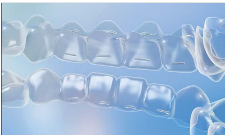
Linguale Power Ridge-Funktion.