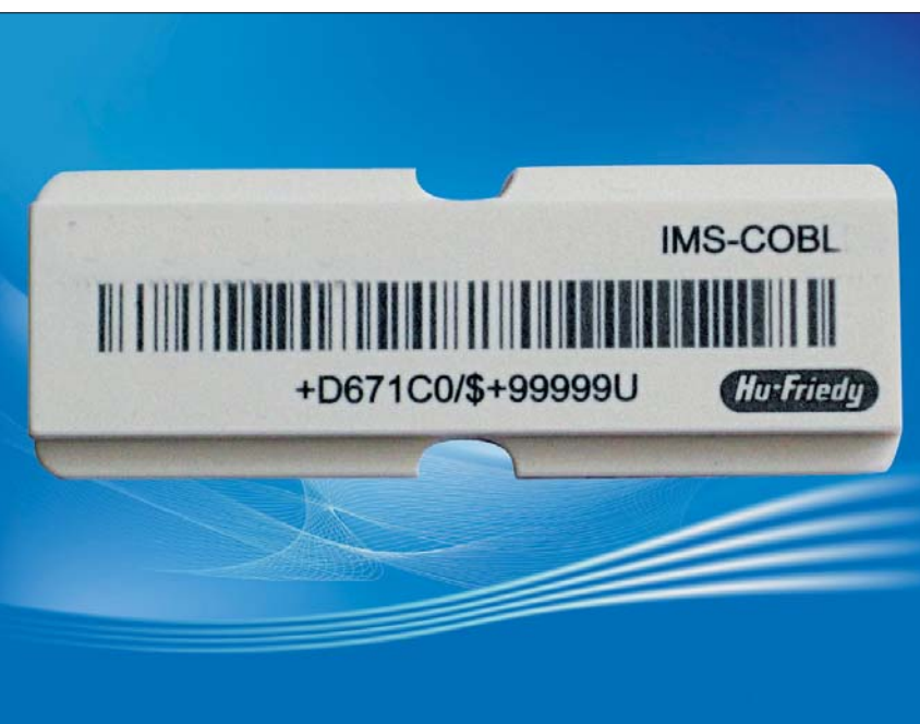
Das neue Barcode-Label von Hu-Friedy ist eine effiziente Lösung für die international eindeutige Kennzeichnung von Sterilisationsinventar.

Industry-Barcode-Standard zur Kennzeichnung von Kleinstprodukten (HIBC-UIM) und unterstützt (Fach-)Zahnärzte und zahnärztliche Dienstleister optimal bei der Umsetzung des seit Ende 2010 obligatorischen Qualitätsmanagementsystems.