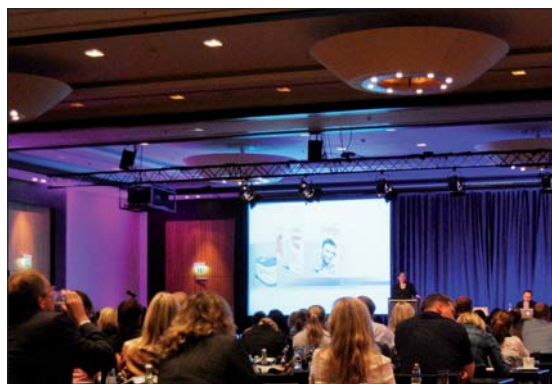
Bereits zum 8. Mal informierten hochkarätige Referenten im Rahmen des Incognito™-Anwendertreffens über Neuheiten rund um den klinischen Einsatz des bekannten Lingualsystems.

Bei Gaumennahterweiterung kann ein Zeitproblem zwischen Herstellung der Lingualapparatur und Ende der GNE entweder durch eine stabile gegossene GNE-Apparatur oder durch Palatinalbar gelöst werden. Falls das Tray tatsächlich nicht exakt platziert werden kann, muss dieses in der Mitte durchtrennt wer-