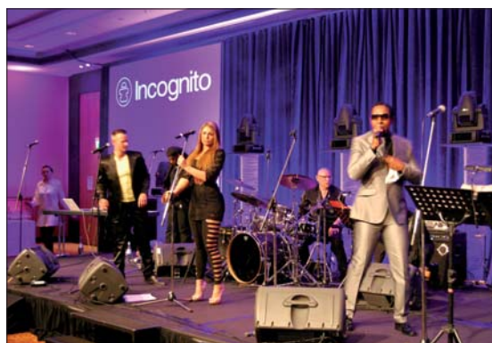
Gute Stimmung – die traditionelle Special Event Party am Abend des ersten Anwendertages.