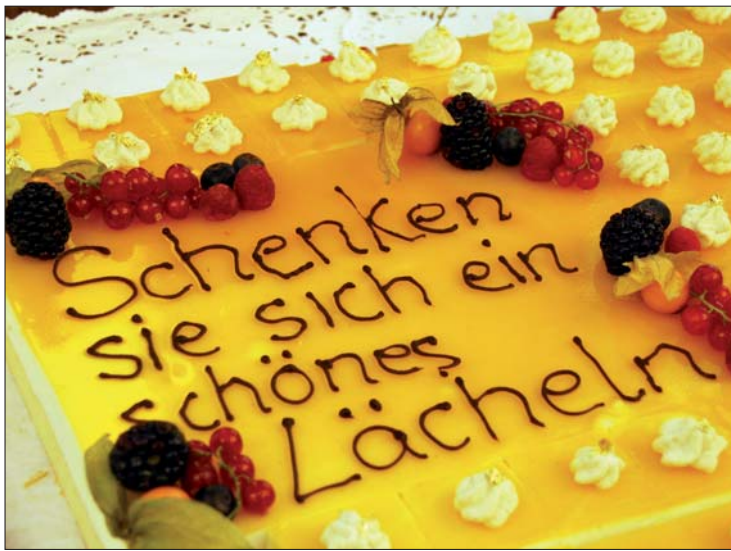
Die Geburtstagstorte des Incognito™ 3-3-Bracketsystems.

den, sofern doch ein transversaler Verlust eingetreten ist. In der Regel ist jedoch kein Palatinalbar notwendig, da die Apparatur stark genug ist und eventuell auch noch transversal erweitert werden kann. Auch bei der Umsetzung von funktioneller Therapie auf Lingualtechnik kann durch Weitertragen des FKO-Gerätes die Herstellung der Apparatur überbrückt werden.