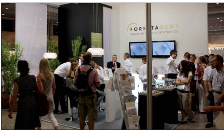
Die verstärkte Nachfrage für selbstligierende Brackets aus dem Hause FORESTADENT setzte sich auch beim diesjährigen EOS-Kongress in Istanbul fort.

Pforzheimer Dentalanbieter FORESTADENT freut sich über Messeerfolg in Istanbul.