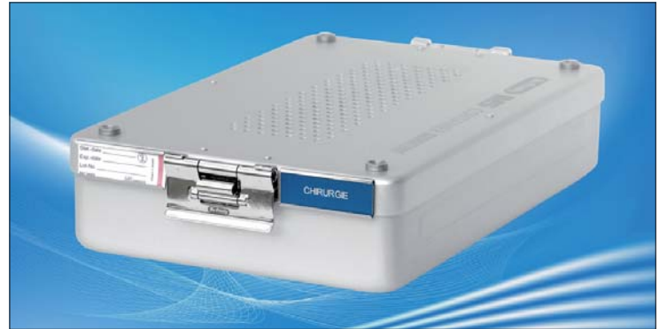
Der neue Sterilisationscontainer von Hu-Friedy.

Hu-Friedy hat die Sterilisationscontainer der Reihe IMS Container Signature Series in den Bereichen Filter, Verschluss und Kompatibilität entscheidend verbessert. Kunden haben die Wahl zwischen Papierfiltern zum einmaligen Gebrauch und permanent verwendbaren aus Teflon. Letztere sind eine besonders wirtschaftliche Lösung, denn ein Austausch wird erst nach 1.200 Sterilisationszyklen fällig. Bei einem Praxisbetrieb an jährlich 220 Arbeitstagen mit fünf Sterilisationszyklen pro Tag ist ein Austausch also erst nach mehr als einem Jahr nötig.