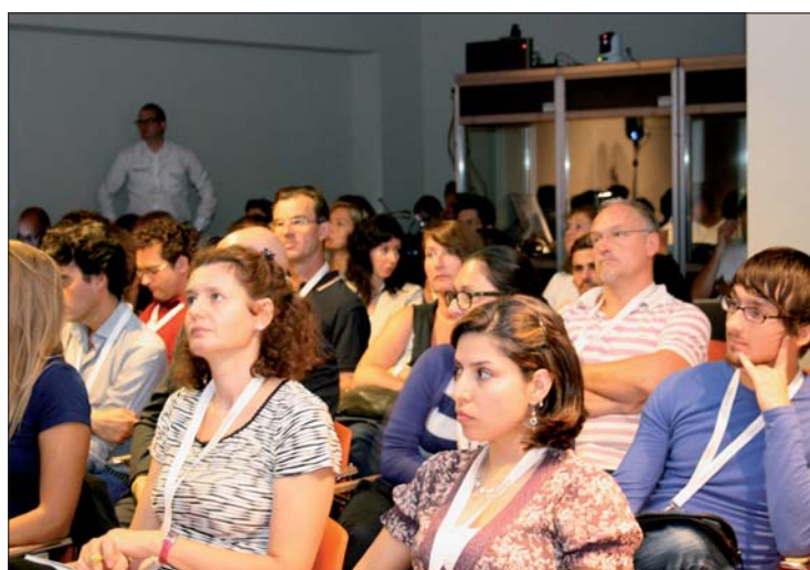
Rund 200 Kieferorthopäden waren zum kollegialen Erfahrungsaustausch an den Gardasee gereist.