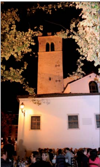
Schmackhafte Weine konnten während des Dinners in Isera genossen werden.

blemstellungen ging der Referent ein und zeigte entsprechende Lösungsansätze auf.