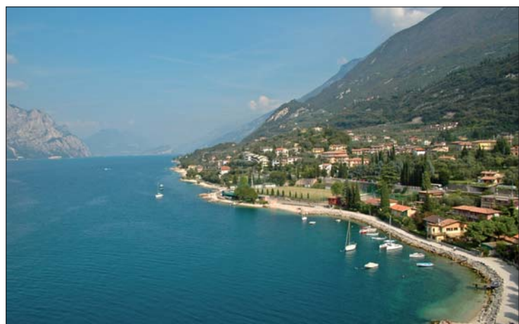
Erfahrungsaustausch vor malerischer Kulisse – in Lazise am Gardasee fand am ersten Oktoberwochenende das IV. Internationale FORESTADENT-Symposium statt.

in Paris zum ersten Mal ausschließlich dem Thema „Linguale Orthodontie“. Dabei standen insbesondere die Anwendung des 2D®-Lingual-Bracketsystems sowie neueste Entwicklungen rund um jene bekannte Behandlungsapparatur im Mittelpunkt.