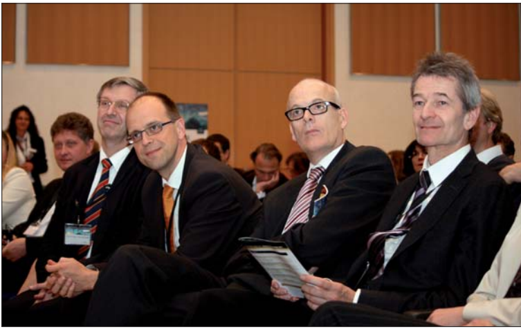
Fast alle Direktoren der kieferorthopädischen Uni-Polikliniken Deutschlands waren der Einladung gefolgt, um dem Pforzheimer Traditionsunternehmen ihren Respekt zu zollen.