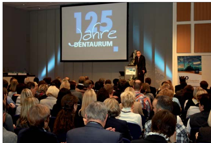
Ca. 500 angereiste Gäste nahmen an der Eineinhalb-Tages-Veranstaltung in Pforzheim teil.