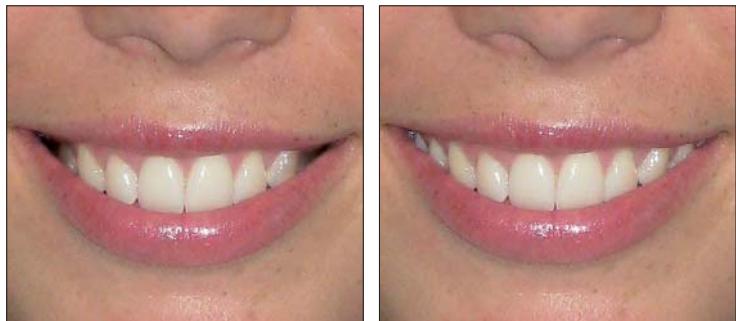
SMILE Rx von FORESTADENT reduziert Bukkalkorridore signifikant und realisiert ein breites, attraktives Lächeln.

alle gängigen Bogenformen – entsprechend des jeweils vorliegenden natürlichen Zahnbogens – eingesetzt werden. Eine neue Bogenschablone erleichtert hierbei die Auswahl. Bei SMILE Rx kommen gleich zwei bewährte SL-Brackets von FORESTADENT zur Anwendung – die aktiven Bio-Quick®- und die passiven Bio-Passive®-Brackets. Beide lassen sich optimal miteinander