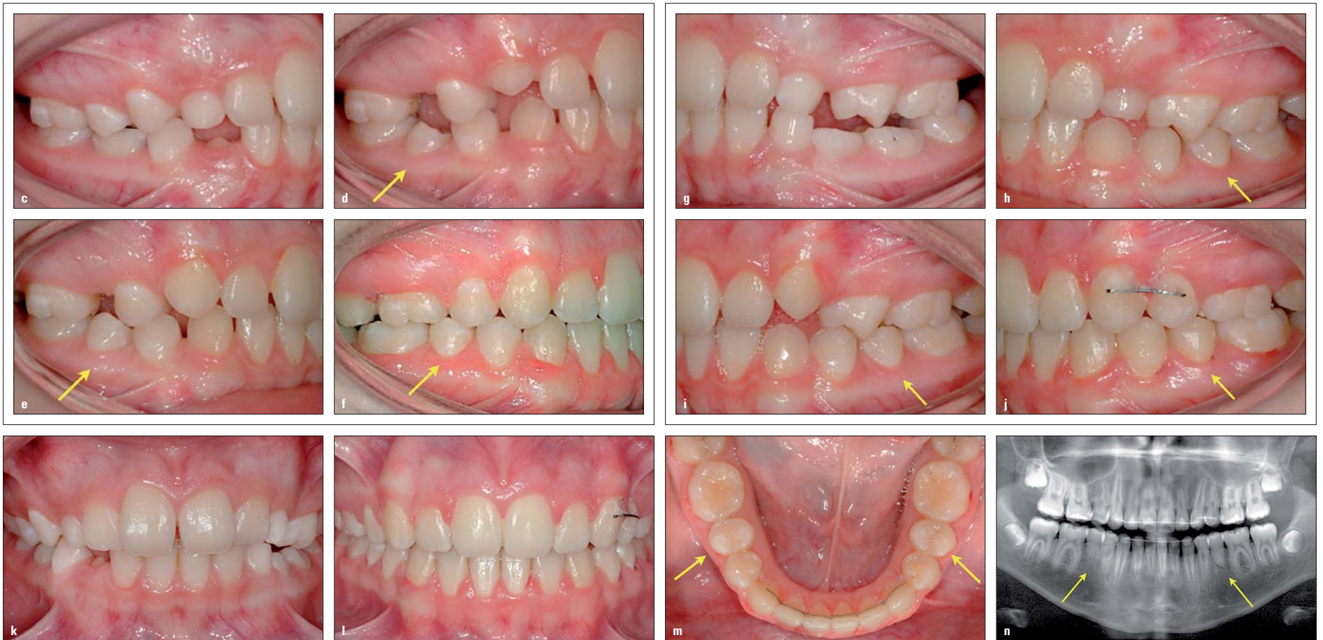
Abb. 1: Elfeinhalbjähriges Mädchen mit einer Klasse II-Malokklusion und fehlenden Anlagen für die unteren zweiten Prämolaren (a, c, g, k). Infraokklusion der unteren Milchmolaren auf der linken Seite (a, g). Autotransplantation zweier nicht durchgebrochener zweiter Prämolaren im OK, um die fehlenden Zähne zu ersetzen (b, siehe Pfeile). Durchbruch der transplantierten Zähne sechs Monate (d und h, siehe Pfeile) und 18 Monate (e und i, siehe Pfeile) nach dem Eingriff. Kieferorthopädisches Schließen der Lücken im Oberkiefer und normale okklusale Beziehungen beim Debonding (f, j, l). Die oberen Prämolaren sind gut im Zahnbogen ausgerichtet (m, siehe Pfeile). Panoramaaufnahme nach erfolgtem Debonding mit den transplantierten Prämolaren (siehe Pfeile), die endgültige Wurzellänge ist kürzer als erwartet, aber das Verhältnis von Krone zu Wurzel ist >1.