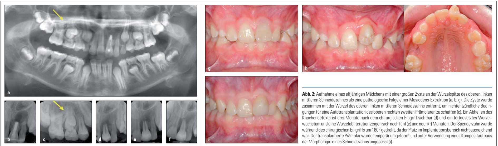
Abb. 2: Aufnahme eines elfjährigen Mädchens mit einer großen Zyste an der Wurzelspitze des oberen linken mittleren Schneidezahnes als eine pathologische Folge einer Mesiodens-Extraktion (a, b, g). Die Zyste wurde zusammen mit der Wurzel des oberen linken mittleren Schneidezahns entfernt, um nichtentzündliche Bedingungen für eine Autotransplantation des oberen rechten zweiten Prämolaren zu schaffen (c). Ein Abheilen des Knochendefekts ist drei Monate nach dem chirurgischen Eingriff sichtbar (d) und ein fortgesetztes Wurzelwachstum und eine Wurzelobliteration zeigen sich nach fünf (e) und neun (f) Monaten. Der Spenderzahn wurde während des chirurgischen Eingriffs um 180° gedreht, da der Platz im Implantationsbereich nicht ausreichend war. Der transplantierte Prämolare wurde temporär umgeformt und unter Verwendung eines Kompositaufbaus der Morphologie eines Schneidezahns angepasst (i).

ren zweiten Prämolaren bei einem Mädchen von zwölf Jahren und fünf Monaten. Weil der Winkel zwischen der langen Zahnachse des verlagerten Zahns und den langen Achsen der Nachbarzähne mehr als 45° betrug, wurde eine transalveoläre Transplantation gewählt, um den unteren zweiten Prämolaren aufzurichten (Abb. 3a b). Dabei ist es für eine erfolgreich verlaufende Zahnheilung entscheidend, den Spenderzahn vorsichtig zu entfernen,