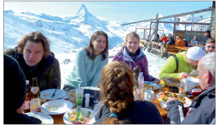
Gut gelaunte Gespräche in der herrlichen Bergluft.