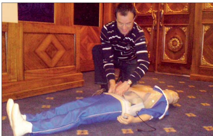
„Hands-on“ im Notfallkurs.