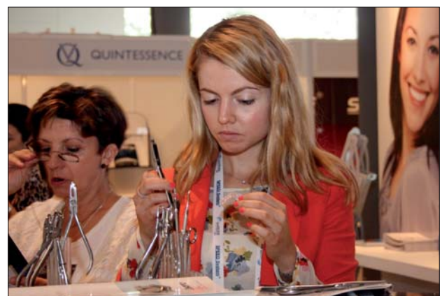
Eine umfangreiche Industrieausstellung zeigte parallel zum wissenschaftlichen Programm Produktneuheiten zahlreicher Firmen.