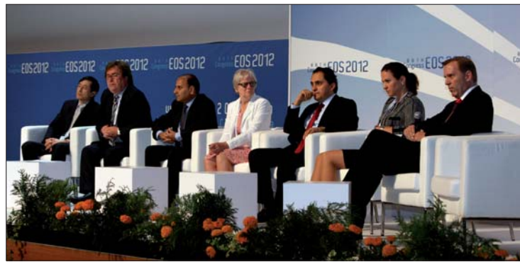
Die Referenten des Vortragsblocks „Skelettale Verankerung“ standen in der anschließenden Diskussionsrunde Rede und Antwort.

Drei Schwerpunktthemen – „Dreidimensionale KFO-Diagnostik“, „Miniimplantate“ und „Neue chirurgische Verfahren in der kieferorthopädischen Behandlung“ – sowie viele freie Themen standen im Mittelpunkt des wissenschaftlichen Programms und lockten zahlreiche Interessierte in die Vortragsräume.