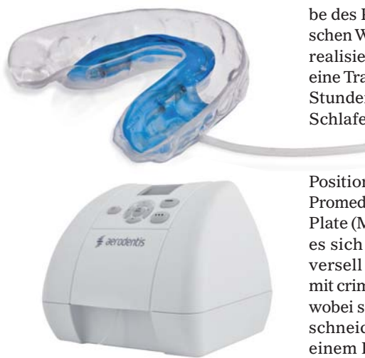
aerodentis (Fa. aerodentis)

Eine kieferorthopädische Behandlungsapparatur (aerodentis) basierend auf pulsierend abgege-