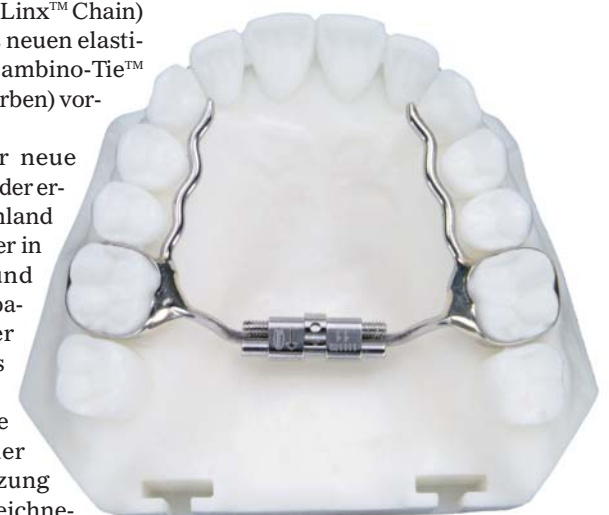
A0621 Micro Expander (Fa. Leone, für DE über die Fa. dentalline).

Bei Leone ist der neue A0621 Micro Expander erhältlich (in Deutschland über dentalline). Der in zwei Größen (8 und 11 mm) verfügbare palatinale Expander bietet ein schlankes Design, zwei extralange Arme, welche die Möglichkeit der anterioren Abstützung sowie eine ausgezeichnete Stabilität und maximalen Komfort gewährleisten. Die Apparatur kann in der Standard-