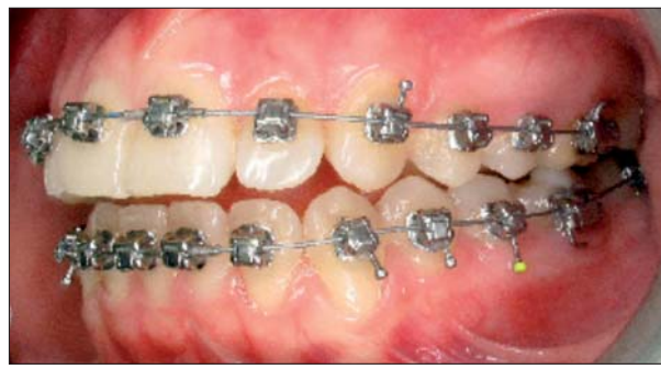
DYB™-Bögen (Fa. G&H Wire)