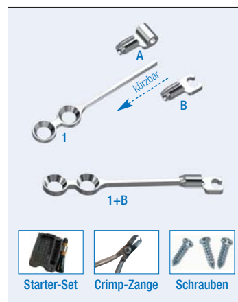
MAP Mini-AnchorPlate System (Fa. Promedia)

des BioBiteCorrector erhältlich. So wurde einerseits der Abstand zwischen Kugelgelenk und Teleskoprohr verkürzt, um Brüchen