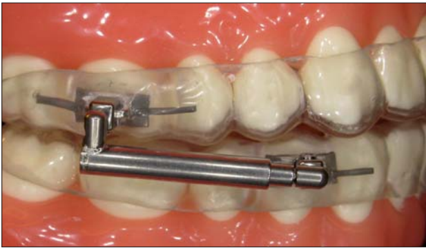
BBC mit neuem Attachment (Fa. BBC-Orthotec)