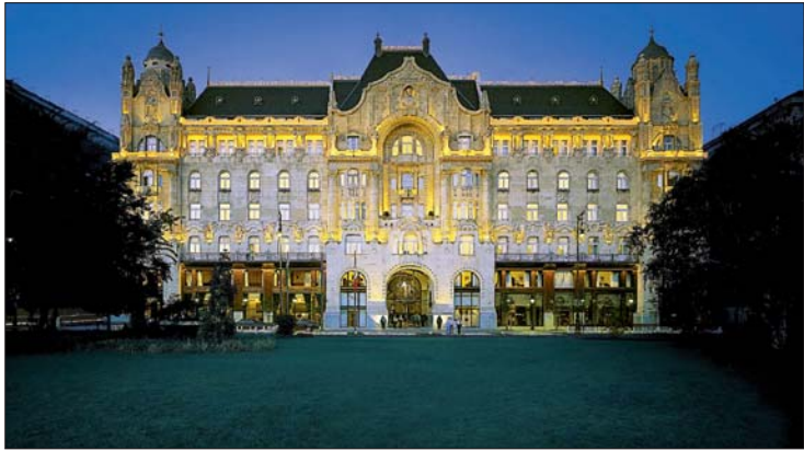
Veranstaltungsort des vom 14. bis 15. September stattfindenden Events wird das im Jugendstil erbaute Four Seasons Hotel Gresham Palace sein.

FORESTADENT lädt zum lingualen Fachsymposium in Ungarns Hauptstadt.