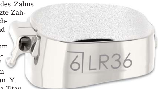
Avex® BX Molarenband mit aufschweißbaren Bukkaltube (Fa. Opal Orthodontics).

position mittels lasermarkierter Pfeile und sichtbarer maximaler Expansionslänge platziert werden oder – wenn der Kiefer besonders schmal ist – mittels zweier Pfeilmarkierungen umgekehrt positioniert werden. Auch können die A0621-Schrauben eingesetzt werden, um eine dentale Expansion im UK zu erreichen.