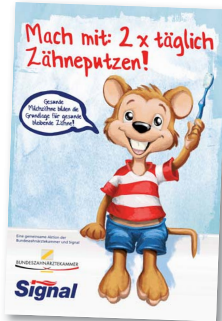
Der Ratgeber „Mach mit: 2 x täglich Zähneputzen!“ ist das Ergebnis einer Kooperation zwischen der FDI, der Bundeszahnärztekammer und Unilever.

Zähneputzen macht Spaß – das ist das Motto der neuen Zahnpflege-Broschüre „Mach mit: 2 x täglich Zähneputzen!“ In einem lustigen Comic erklärt Fritz, die Mutmach-Maus, wie man richtig Zähne putzt, um dem Kariesbakterium Freddy Schmuttel keine Chance zu geben. Der Zahnputzplan belohnt die Kinder täglich für die richtige Zahnpflege: Nach jedem Putzen darf ein Feld ausgemalt werden – morgens eine Sonne, mittags eine Blume und abends ein Stern. Die gut erklärten Ernährungstipps unterstützen zusätzlich die Kariesprävention. Fritz, die Mutmach-Maus, nimmt den Kindern durch die Motivation zur richtigen Zahnpflege auch die Angst vor regelmäßigen Zahnarztbesuchen.