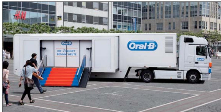
Oral-B TriZone Tour – der Oral-B Truck macht in zahlreichen Städten Deutschlands, Österreichs und in der Schweiz Station.

Im Innern der mobilen Infostation informieren Fachberater über die tägliche Prophylaxe, beantworten Fragen und geben praktische Tipps. Die Patienten können anhand von speziellen Demo-Modulen die Unterschiede von Hand- und Elektrozahnbürsten selbst erleben. Im Fokus steht die neue Oral-B TriZone. Diese richtet sich speziell an Patienten, die ein ähnliches Putzgefühl wie mit ihrer Handzahnbürste beibehalten und doch von der gründlichen Reinigungsleistung einer Elektro-