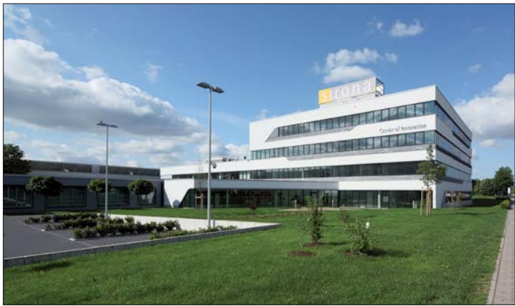
Das Sirona Innovationszentrum am Standort Bensheim 2012. Hier werden die Dentalinnovationen entwickelt.

Sirona blickt neben dem 50. Standortjubiläum in Bensheim auf eine 135 Jahre alte Firmengeschichte sowie auf 15 Jahre seit Gründung der Sirona Dental Systems GmbH zurück.