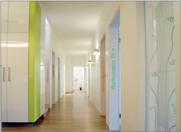
Im Gang weist die orangene Schrift im Türrahmen darauf hin, dass das sich das KFO-Zimmer von den anderen Behandlungszimmern auch fachlich unterscheidet.

In Zusammenarbeit mit dental bauer erfolgte komplette Renovierung und Neueinrichtung.