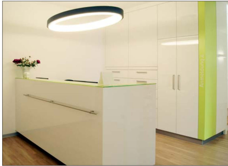
Geschick gelöst – hinter der Rezeption geht es hinauf zu den Funktionsräumen im Dachgeschoss.