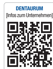
DENTAURUM [Infos zum Unternehmen]