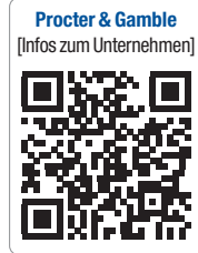
Procter & Gamble [Infos zum Unternehmen]