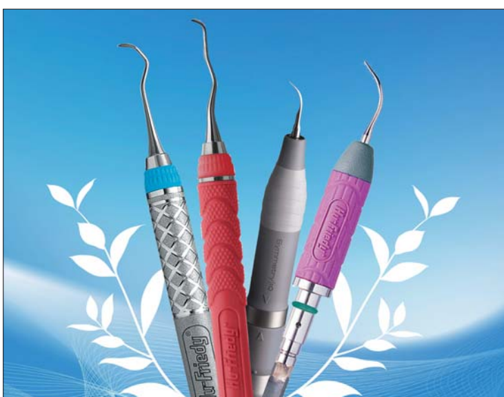
Ein Beitrag zum Umweltschutz: Das Recyclingprogramm von Hu-Friedy.

Endspurt bei der Recyclingoffensive von Hu-Friedy, dem führenden Hersteller von Dentalprodukten: Noch bis Ende 2013 können auf allen Fach- und Infodental-Messen alte Instrumente am Stand von Hu-Friedy abgegeben werden. Das gesammelte Material wird wiederverwertet und dient als Rohstoff für neue Produkte, etwa in der Bau- und Autoindustrie. Ein besonderes Angebot gilt für die Rückgabe von Scalern und Kü-