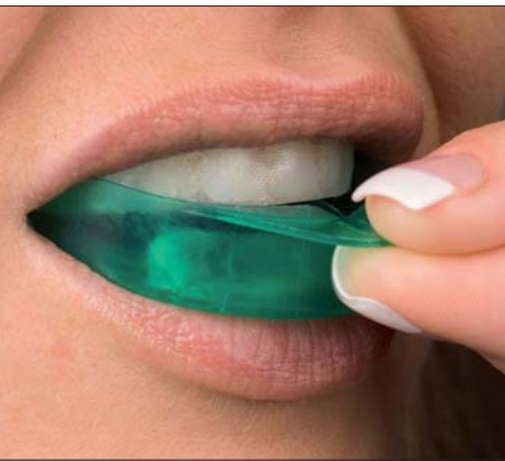
Sofort starten – mit den gebrauchsfertigen UltraFit-Trays von Opalescence Go.

Sie mögen Opalescence TrèswHITE Supreme? Dann werden Sie Opalescence Go lieben!