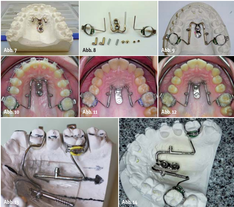
Abb. 7: Individuell gegossenes Verbindungsteil (Suprakonstruktion) zwischen Miniimplantaten und Distal-Jet-Elementen. – Abb. 8: Einzelteile für die Herstellung eines gegossenen Distal-Jets mit Miniimplantaten. – Abb. 9: Miniimplantat-gestützter Distal-Jet – gegossen, auf dem Modell. – Abb. 10: Fallbeispiel: gegossener Distal-Jet mit Miniimplantaten in situ. – Abb. 11: Fallbeispiel: gegossener Distal-Jet mit Miniimplantaten beim Einsetztermin. – Abb. 12: Fallbeispiel: gegossener Distal-Jet mit Miniimplantaten während der Distalisation. – Abb. 13: Seitenansicht konventioneller Distal-Jet auf dem Modell. – Abb. 14: Seitenansicht gegossener Distal-Jet (Miniimplantat-gestützt) auf dem Modell.

tal-Jet-Teleskope wurden anschließend angelasert. Es entstand eine stabile und passgenaue maximale Verankerungseinheit, der gegossene Distal-Jet (Abb. 9, 14).