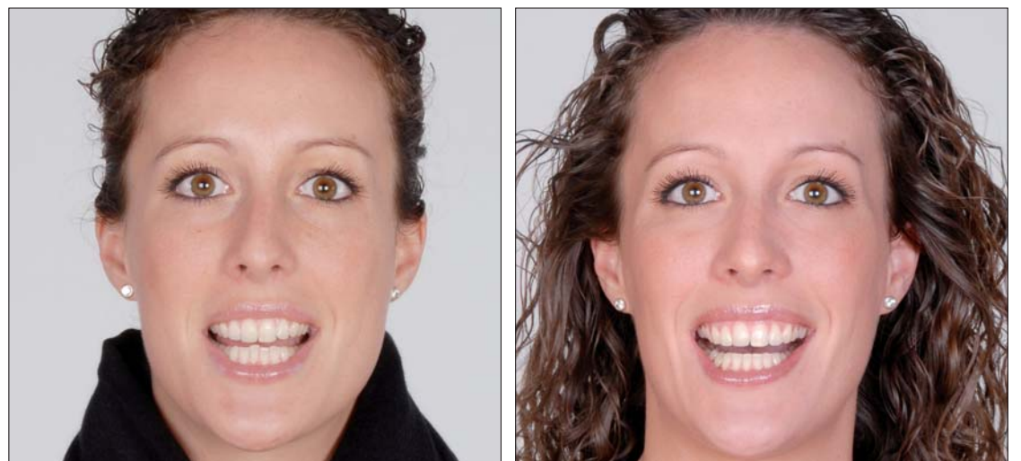
Abb. 3, 4: Die Verwendung von Vorher-Nachher-Bildern ist nicht mehr untersagt. Sie dürfen jedoch keinesfalls in missbräuchlicher oder irreführender Weise genutzt werden.