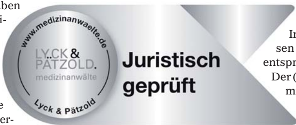
Abb. 5: Eine juristische Überprüfung der Webseite schützt vor unangenehmen und teuren Abmahnungen.

RA Pätzold: Wir stellen den Praxen, deren Homepage wir geprüft haben, ein Prüfsiegel in Form einer Grafik zur Verfügung, mit dem diese beispielsweise in ihrem Impressum darauf hinweisen können, dass die Seite entsprechend geprüft wurde. Der (Fach-)Zahnarzt kann damit auch nach außen hin kenntlich machen, dass er die rechtlichen Rahmenbedingungen und den Datenschutz ernst nimmt und beachtet (Abb. 5). KN