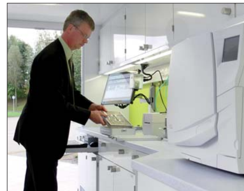
Spezialisten von Henry Schein zeigen im Hygienemobil, wie eine RKI-konforme Sterilgut-aufbereitung inklusive rechtssicherer Dokumentation auch bei engen Raumverhältnissen betrieben werden kann.

Die aktuellen Termine des Hygienemobils sowie weitere Informationen erfahren Sie unter hygiene@henryschein.de