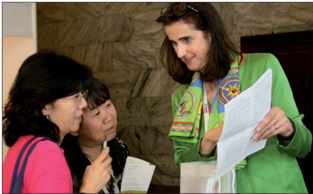
Rund 80 Aussteller aus aller Welt stellten ihre Produktneuheiten im Rahmen der parallel stattfindenden Industriemesse vor.