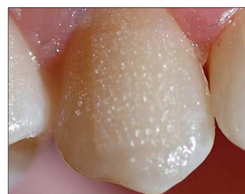
Friction Pad (Fa. Ortho Caps).