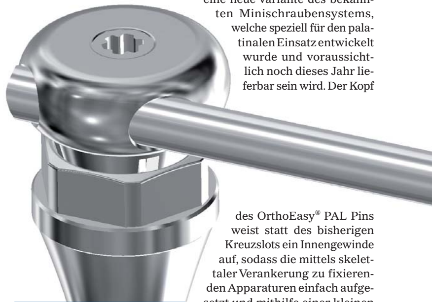
OrthoLox mit neuer Patrizinform (Fa. Promedia).

mechanismus sowie einem entfernbaren Positionierungsguide für die direkte Klebetechnik ausgestattet, welcher ein korrektes Platzieren am Zahn gewährleistet.