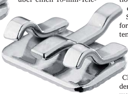
2D® Large Twin Brackets (Fa. FORESTADENT).

sionen als Mid-Force- oder Low-Force-Variante angeboten. Des Weiteren zeigte gleiche Firma die erstmals zum AAO vorgestellte Klasse II-Apparatur PowerScope™, welche ohne Labornotwendigkeit direkt am Stuhl eingesetzt werden kann und laut Hersteller absolut leicht handhabbar ist. Das Gerät wird von Bogen zu Bogen eingebracht, wobei ein spezieller Sechskant-Schraubendreher erforderlich ist. Es verfügt über einen 18-mm-Tele-