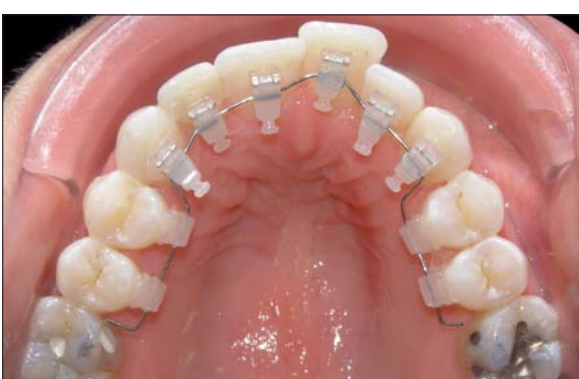
phantom™ 2.0 hybrid (Fa. Gestenco).