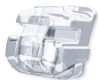
Damon™ Clear2 (Fa. Ormco).

Kieferorthopäden nach Abschluss einer Behandlungsphase ein detaillierter Statusbericht zum Verlauf des jeweiligen Patientenfalls gegeben, bei dem durch Überlagerung der gewünschten Soll-Situation nach den ersten acht Alignern und der tatsächlichen Ist-Situation eine genaue Auswertung und Kontrolle des Zwischenbefundes realisiert werden kann.