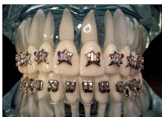
Vogue™ Fashion-Bracket (Fa. Gestenco).