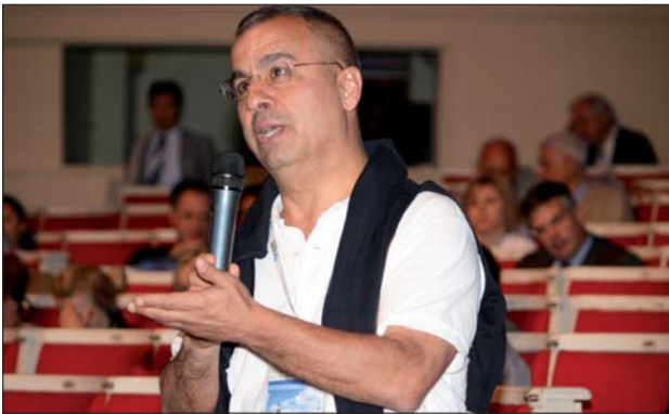
Im Rahmen der Diskussionsrunden nutzten einige Teilnehmer die Möglichkeit, Fragen an die Referenten zu richten.