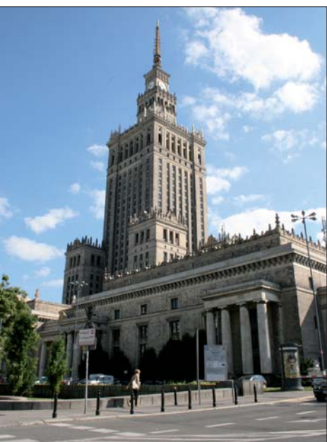
Vom 18. bis 22. Juni 2014 fand in Warschau der 90. Kongress der European Orthodontic Society statt. Veranstaltungsort war der Kultur- und Wissenschaftspalast – ein riesiger Komplex, welcher Mitte der 1950er-Jahre erbaut wurde. Das 231 m hohe Gebäude, ein Geschenk der damaligen Sowjetunion an Polen, war ursprünglich nach Josef Stalin benannt worden, was ihm im Volksmund den Spitznamen „Stalinstachel“ oder „Stalins Rache“ einbrachte.

Ab Januar 2015 sind orthocaps® Schienen (Fa. Ortho Caps) mit Friction Pads erhältlich. Dabei handelt es sich um neue unauffällige Attachments, die aufgrund ihrer strukturierten Oberfläche die Reibung zwischen der inneren Alig-